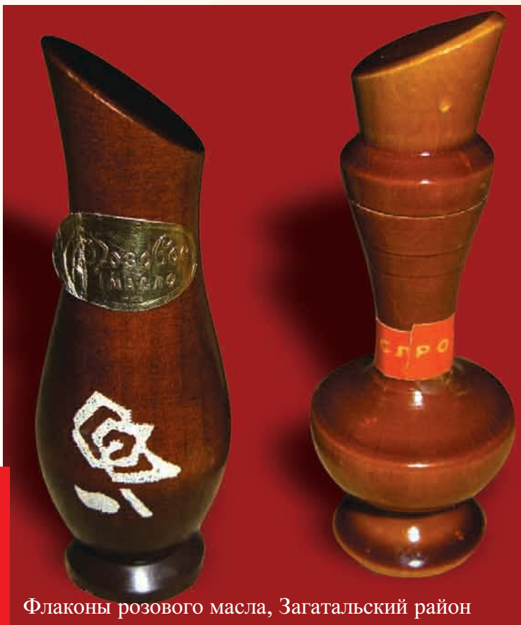
Флаконы розового масла, Загатальский район

Страны, в которых культивируют розу, можно перечислить по пальцам: Турция, Болгария, Франция, Италия и Марокко. В конце XVIII - начале XIX столетия роза появля-