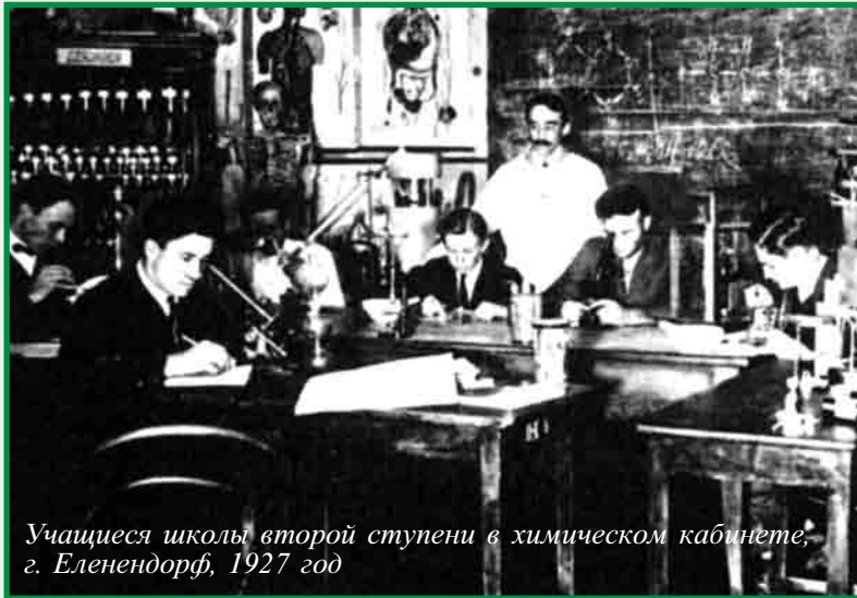
Учащиеся школы второй ступени в химическом кабинете, г. Еленендорф, 1927 год