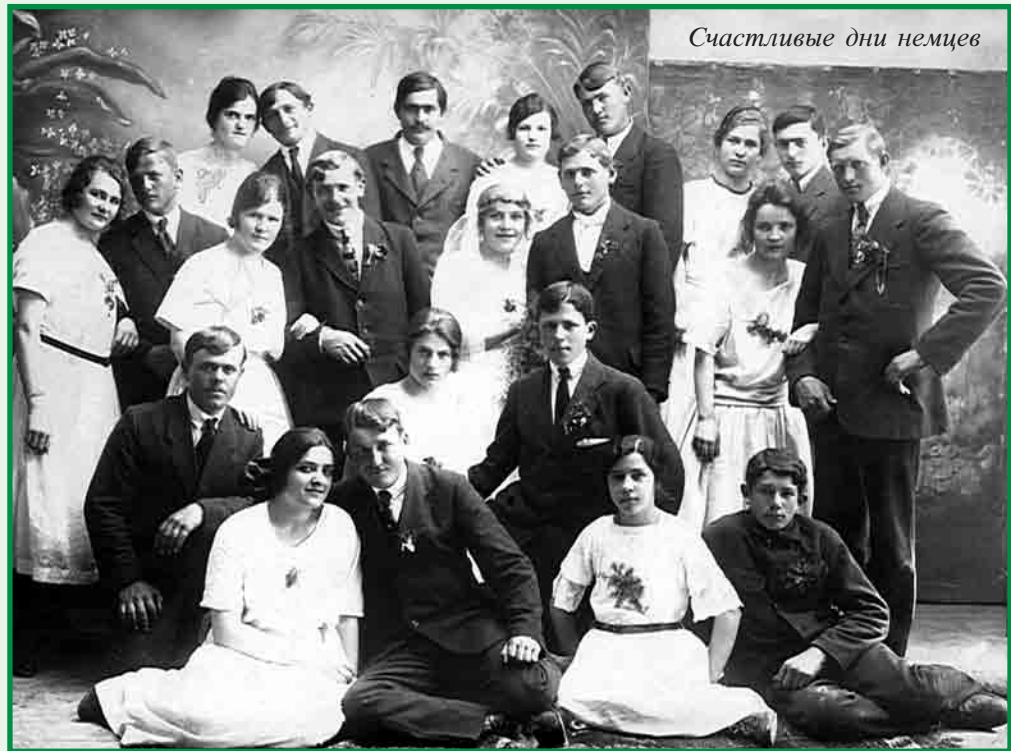
Счастливые дни немцев

Колонии представляли собой замкнутое экономическое и культурное пространство без административно-территориального деления. Повседневная жизнь в колонии проходила в соответствии с укладом жизни в