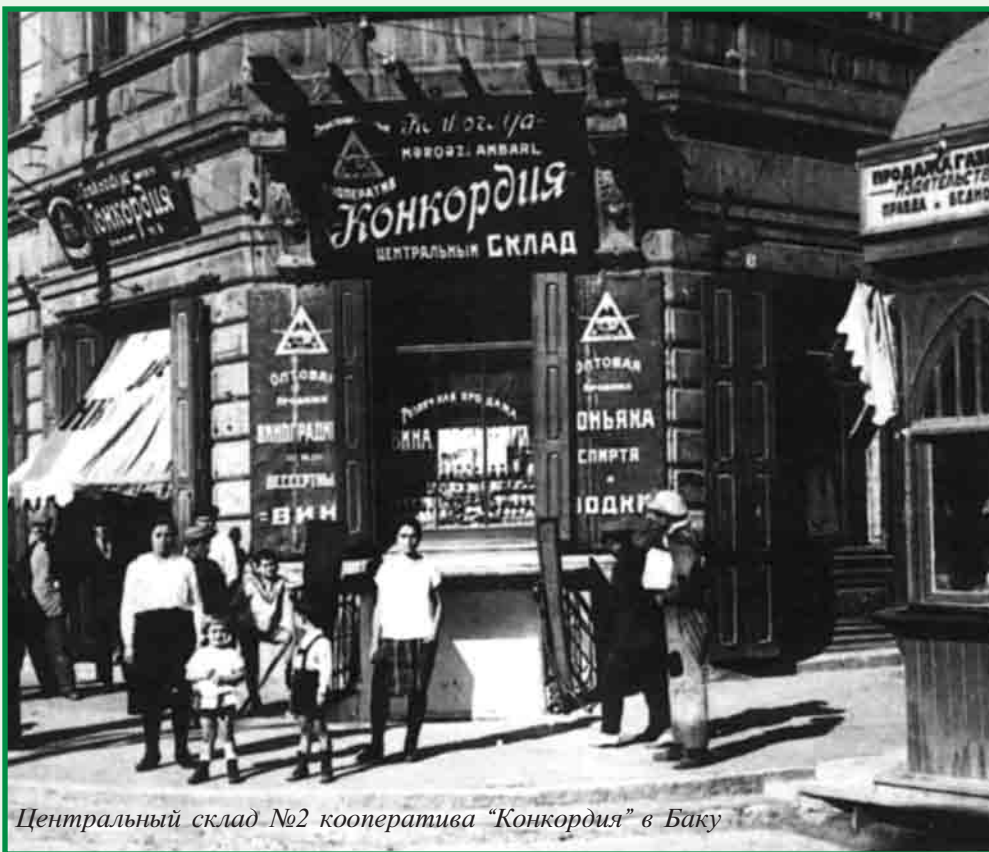
Центральный склад №2 кооператива "Конкордия" в Баку