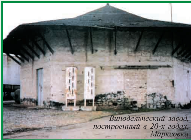
Винодельческий завод, построенный в 20-х годах. Марксовка

депутатских мест одно было закреплено за представителем немецкого населения.