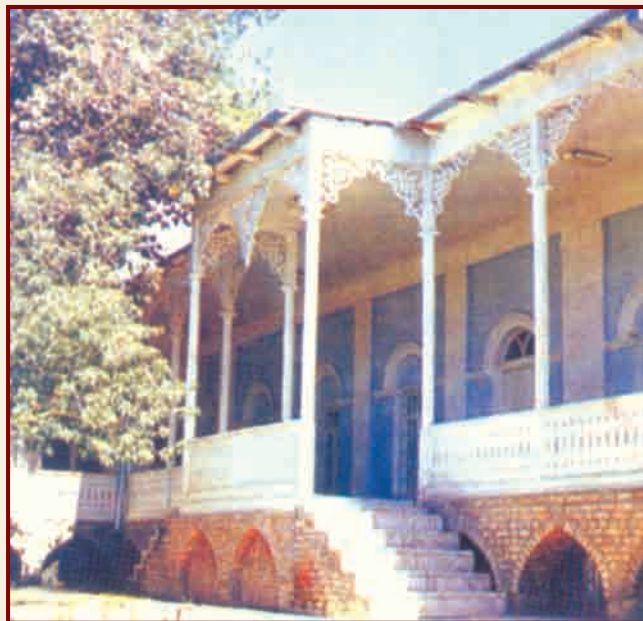
Жилой дом. XIX век. г. Нахчыван

Нахчыване искусство художественной вышивки и обработки дерева. Не случайно этим народным искусствам посвящены исследования искусствоведов Г.Алиевой и А.Алиевой. Образцы их были известны на всем Востоке. В анонимном труде XIII в. "Чудеса мира" указывается: "В Нахчыване изготавливаются бытовые изделия - прекрасные ткани, тонкие покрывала, деревянные чаши. Узорчатая посуда, изготавливаемая нахчыванскими мастерами из дерева, развозится в качестве подарков по всему свету". В обработке дерева ши-