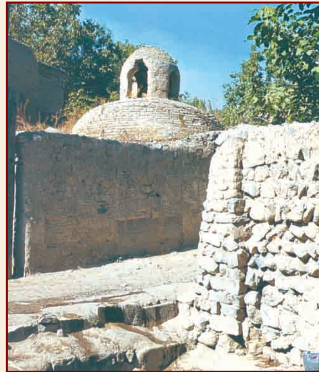
Средневековый жилой квартал "Айлис"