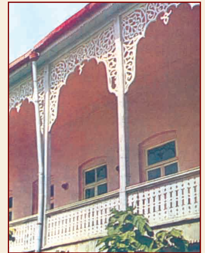
Жилой дом. XIX век. Нахчыван

Средневековая архитектурная школа Нахчывана была знаменита на всем Востоке. Она проявляется как в жилых, так и общественных зданиях. Строящиеся Ордубада привлекают особое внимание как с точки зрения архитектуры, так и этнографии, и известны в народе как "харпиштали эвлер". На первом этаже этих домов имеются коридоры с полукруглыми восьми- или шестиконечными арками, неповторимые по технике строительства. Эти коридоры, выложенные жженным кирпичом с высоким художественным вкусом и имеющие несколько дверей, представляют собой ходы сообщения, соединяющие комнаты и двор. Очень характерным является и украшение окон ажурными витражами. По мнению специалиста истории архитектуры Р.Салаевой, на всем