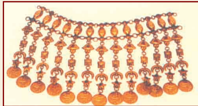
"Ожерелье". XIX век. Нахчыван

Азербайджан - одна из уникальных историко-культурных областей земного шара. Этот удивительный край является одним из очагов древней цивилизации, где можно наблюдать основные этапы развития общества. Вместе с тем каждый регион страны вносит свой вклад в формирование общенародной традиционной культуры. Хотя отдельные области и различаются по своим особенностям, вместе они составляют единую общеазербайджанскую культуру и в этом смысле дополняют друг друга. Не исключением в этом отношении является и древний Нахчыванский край. Исторические, археологические и этнографические данные неопровержимо доказывают, что азербайджанцы являются автохтонным населением края. Историк А.Климов писал ещё в 1938 г. о том, что изучение археологических памятников Нахчывана "поз-