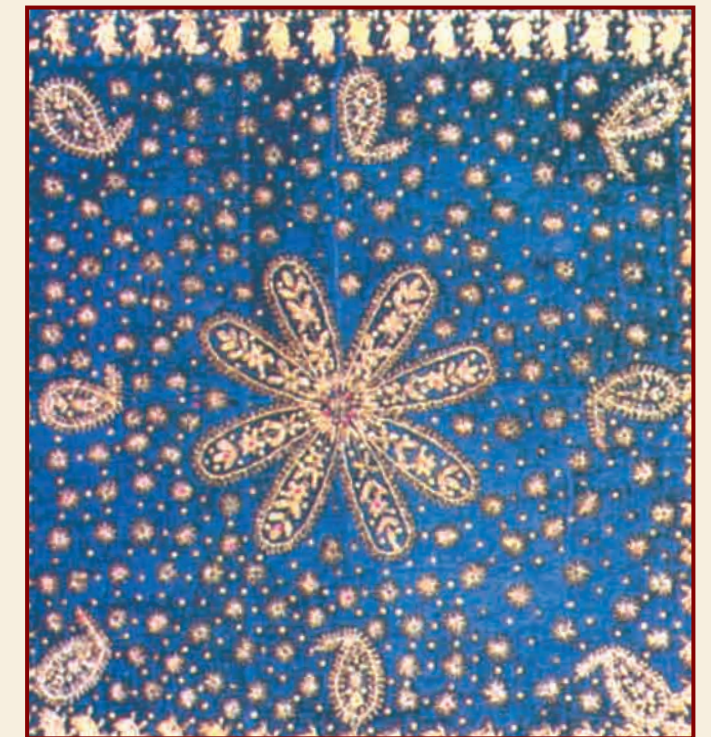
Вышивка. XIX в. Нахчыван