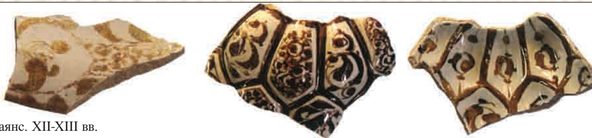
Фаянс. XII-XIII вв.

The author gives brief characteristics of medieval ancient settlement of Shamkir, the inner town and its suburbs as well as information about the archeological finds in the architectural layers of different segments of the site dated 8-19 centuries AD. These archaeological finds have shown the developed city culture of ancient Shamkir. However, as the result of Mongolian invasion the town had been destroyed and never was restored again.