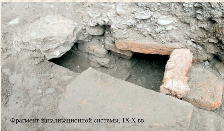
Фрагмент канализационной системы, IX-X вв.