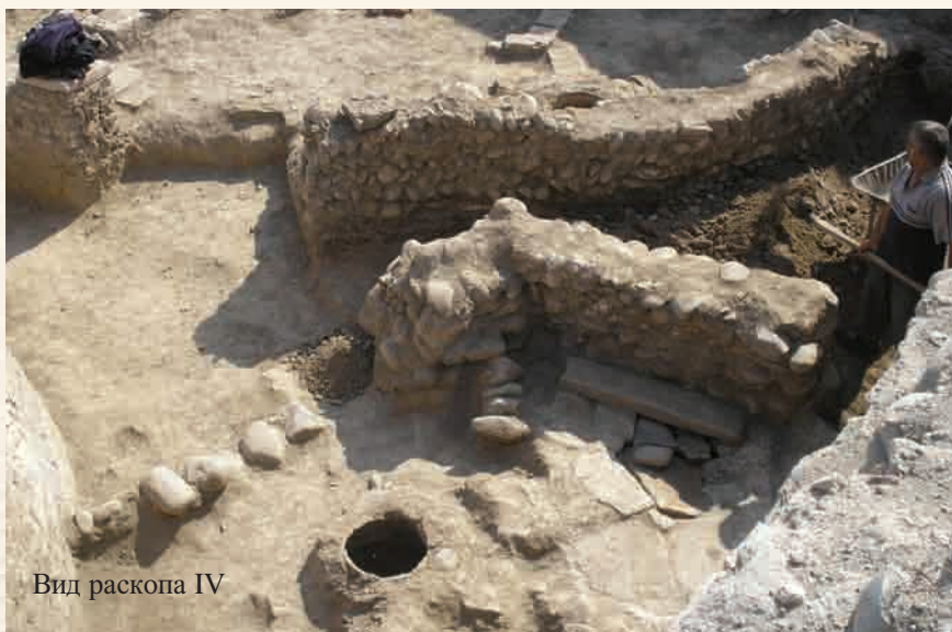
Вид раскопа IV

в восточной части городища, на левом берегу реки Шамкирчай. Она в плане прямоугольная, вытянута с юга на север и занимает площадь около 1 га. Стены цитадели возведены комбинированной кладкой и сохранились довольно хорошо. Эта кладка представляет собой чередование рядов обожженного кирпича, колотого речника и тесаного местного белого камня. Следует отметить, что город Шамкир был одним из центров архитектурной школы Аррана, характерной архитектурно-стилистической особенностью которой является полихромная комбинированная кладка стен. Кладка стен цитадели очень близка к «гянджинской» и вместе с тем имеет свои локальные черты (4, с. 70-89).