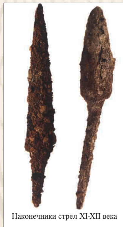
Наконечники стрел XI-XII века

Особенно интересные результаты удалось получить при раскопках внутри цитадели, в ее восточной части, где раскопки велись на площади 450 кв.м. Толщина культурного напластования на этом участке достигает 5 м. Выделяются два культурных слоя: нижний – средневековый и