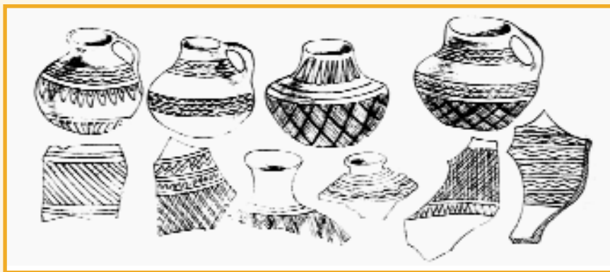
Keramik karabaxskix kurqanov (Ballukaə №1)