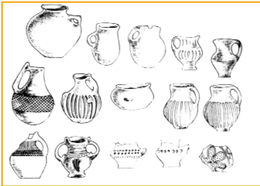
Keramika karabaxskix kurqanov (kurqan №2 Xodjalinskoqo moqilğnika)