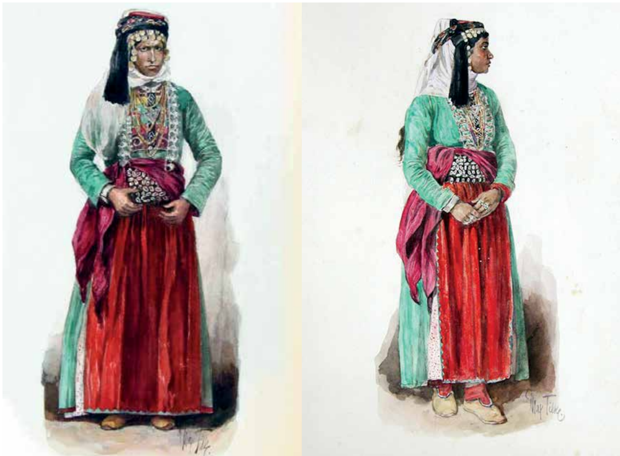
Женщины из курдов-йезидов. Рисунок М.Тильке. 1830-е годы

торыми армянскими СМИ концепция «одна нация, одна религия, одна культура» направлена острием на религиозные меньшинства, которые воспринимаются как секты, подрывающие армянскую государственность. В целом этнические меньшинства в Армении подвергаются дискриминации в различных сферах жизни. В результате миграционного оттока их численность неуклонно уменьшается.