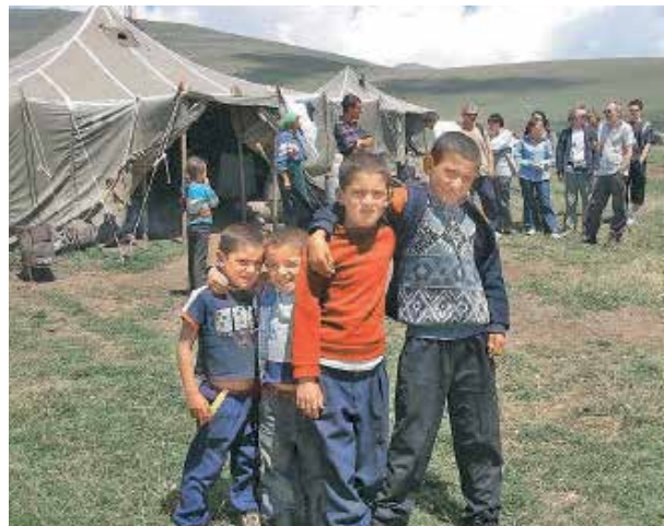
Курды-йезиды Армении, лишённые элементарных бытовых условий

Доклад Консультативного комитета по Рамочной конвенции о защите национальных меньшинств Совета Европы и другие источники показывают, что Армения не соблюдает международные