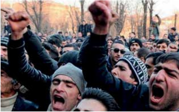
Курды-йезиды Армении требуют уважения своих прав

национальных меньшинств выразили сомнения в достоверности собранных данных. В частности, ряд представителей национальных меньшинств указывали, что им не приходилось видеть интервьюера, проводящего перепись.