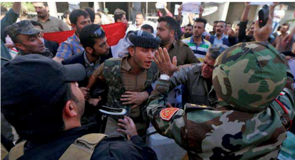
На разгон акции протеста курдов-йезидов правительство Армении бросило военную полицию

После провала попытки заселить оккупированный нагорно-карабахский регион Азербайджана сирийскими армянами армянские власти решили воспользоваться ситуацией с иракскими курдами-йезидами, некоторые регионы компактного расселения которых были захвачены террористами «ИГИЛ». В 2014 году пресс-секретарь «НКР» Давид Бабалян заявил, что представляемый им сепаратистский режим готов предоставить убежище иракским йезидам. Местом их поселения был выбран оккупированный Лачинский район Азербайджана. Это был далеко идущий план: во-первых, Лачинский район имеет важное стратегическое значение, а во-вторых, в случае возобновления войны курды-йезиды без труда могли превра-