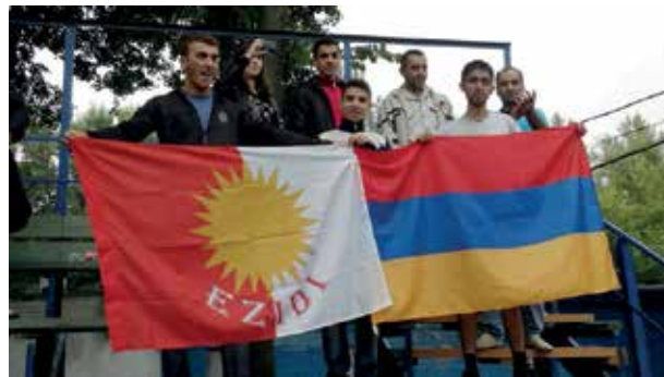
Курды-йезиды Армении требуют автономию

них ни организационных, ни людских ресурсов. В связи с этим Консультативный комитет отмечает, что в течение последних пяти лет законодательная база и политика правительства в отношении поддержки культурной деятельности национальных меньшинств не претерпела изменений.