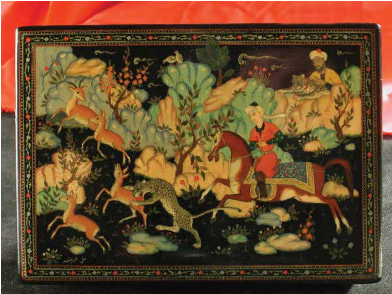
Сцена охоты с гепардом на средневековой шкатулке

короткой дистанции способен развить скорость бега 100-115 км /час, совершая на бегу скачки от 6 до 8 м.