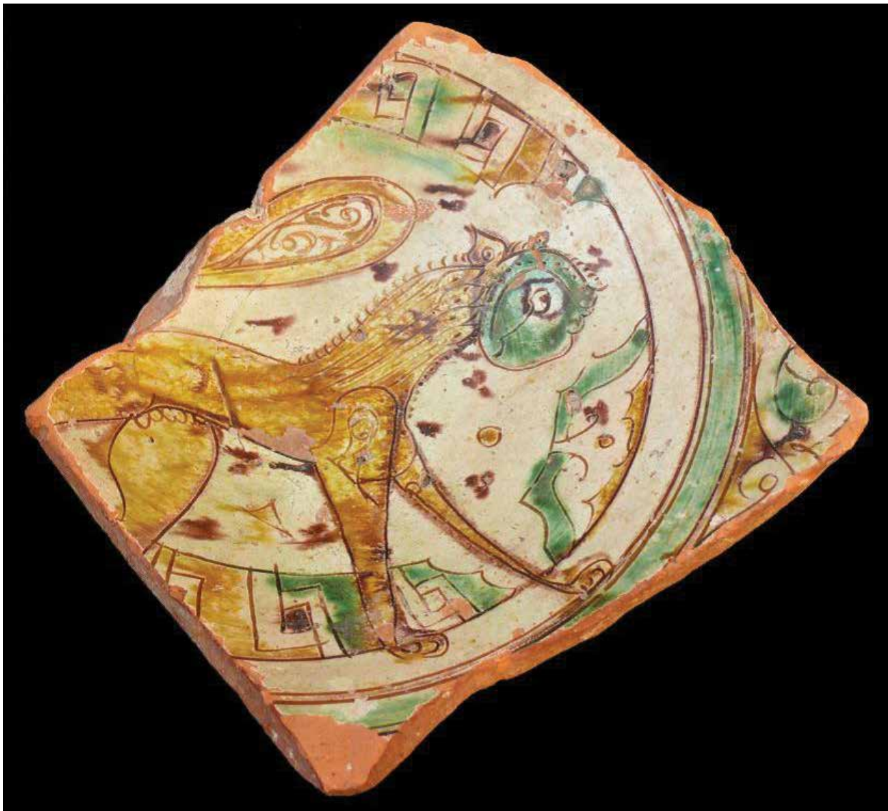
Изображение гепарда на фрагменте глазурованной полихромной чаши (городище Бяндован). Национальный музей истории Азербайджана

археологических раскопок в Гобустане была обнаружена челюсть гепарда (14). Изображения гепардов и львов на скалах Гобустана близ Баку относятся к бронзовому веку. Детальные рисунки представителей семейства кошачьих со всеми присущими им чертами имеются также на скалах Гемигая в Нахчыване (10). Мотивы гепарда встречаются в художественных металлических изделиях Кавказской Албании. Заслуживает внимания бронзовый подсвечник IV века, найденный в некрополе Шатырлы вблизи города Барда . Подсвечник состоит из фигурки гепарда и тарелочки с выступом в центре. Фигурка гепарда изготовлена путем литья и выполнена реалистично: голова с ярко выраженным хищным оскалом, маленькие торчащие уши, стройная шея, тонкое удлиненное