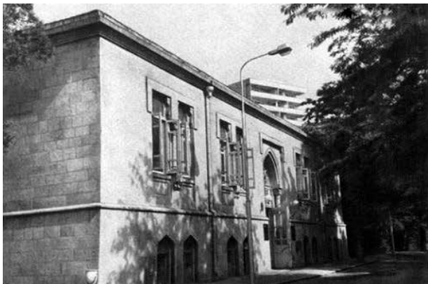
Здание общества "Саадет" в Баку, построенное в 1912 году

классов носили шапки с белыми полосками и серебряной пластинкой посередине. Выпускникам прогимназии позволялось наведываться в родную школу в черном костюме с галстуком.