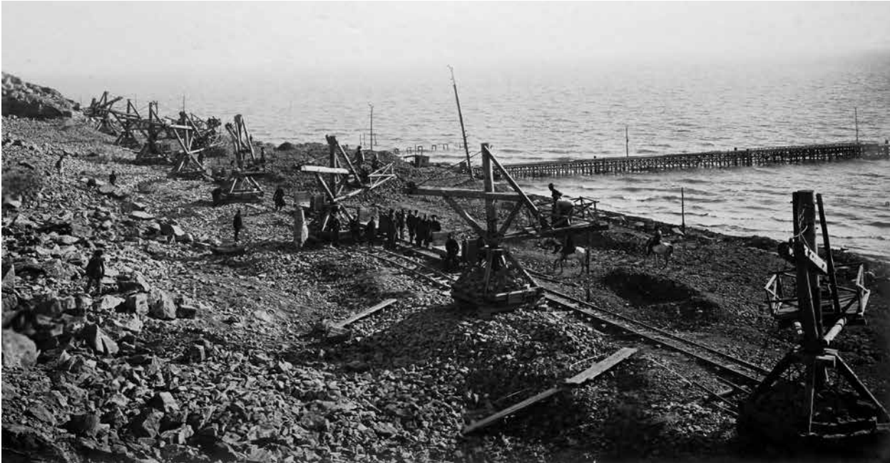
Шиховский карьер и Южная пристань. Краны конструкции П.Потоцкого. Июнь 1911 г. Фотография публикуется впервые

площадь месторождения. Поэтому сооружались параллельные и поперечные эстакады, связанные друг с другом (10).