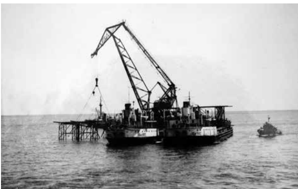
Установка блоков основания крановым судном. Начало 50-х годов XX века

нографов. Были определены спектры высот волн, возвышения гребня волн, изучена связь крутизны волны с глубиной моря, разработан метод расчета волнового воздействия на нефтепромысловые гидротехнические сооружения (11).