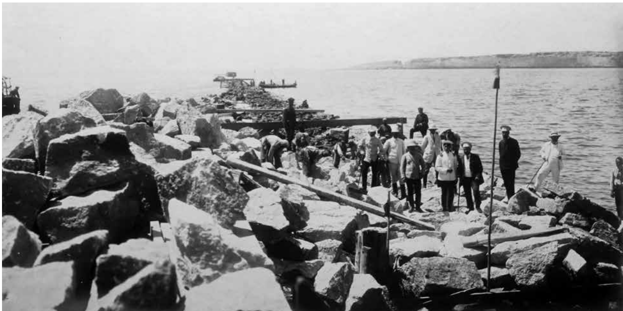
Начало укладки камней на Южном молу Биби-Эйбатской бухты. Май 1910 года. Фотография публикуется впервые

Объем буровых работ в Биби-Эйбатской бухте увеличивался с каждым годом. В 1926-27 годах он составил 31 тыс. м., что позволило увеличить добычу нефти из морских скважин за эти годы до 714 т.