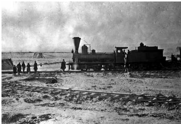
Поезд на станции Хаджигабул. 1900 г. Фотография публикуется впервые

строительными работами было возложено на инженера Крубца.