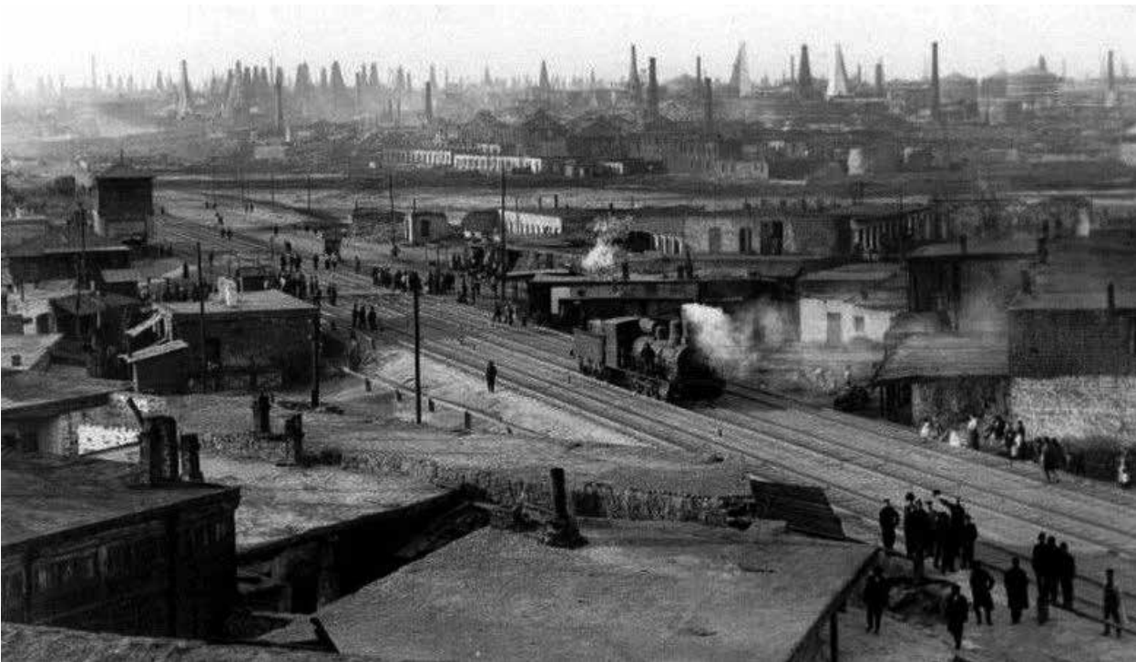
Прибытие паровоза на станцию Сабунчи. 1880 г.

Появление железных дорог в Азербайджане неразрывно связано с историей нефтяной промышленности страны. Первое время после включения Северного Азербайджана в состав Российской империи в 1828 году нефть, добытую с абшеронских скважин, везли на переработку в Баку или судами через Каспий и далее по Волге в метрополию, заливая в традиционные деревянные бочки или бурдюки. В середине XIX века число аробщиков, занимавшихся перевозкой нефти, достигало 10 тысяч, и их груженные нефтью арбы составляли неотъемлемую часть абшеронского пейзажа.