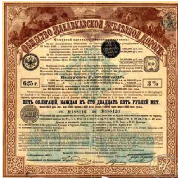
Акция Общества Закавказской железной дороги

Финансовый кризис 50-х годов не позволил правительству в 60-е годы выделить необходимые средства на крупномасштабные реформы. Взамен правительство содействовало частным структурам в осуществлении различных широкомасштабных проектов. В 1861 году власти нашли нужным под-