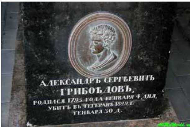
Могилы А.С.Грибоедова в Тифлисе

Эта церемония описана в записках секретаря Назарали-хана, который указывал, что на протяжении всего движения от своей резиденции до шахских покоев во дворце посла России сопровождали изъявления самого глубокого почтения, и даже торговцы на рынке при виде процессии останавливались и снимали шапки. На основе слышанного автор записей сообщает, что аудиенция посла у шаха длилась 50 минут, причем шах во время приема надел корону, украшенную таким множеством драгоценных камней, что сразу же по окончании аудиенции снял непомерно тяжелый головной убор, вздохнув с облегчением (12).