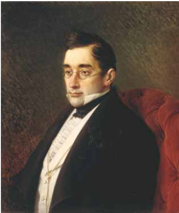
А.Грибоедов. Художник И.Крамской. 1875 г.

Совсем недавно прошел юбилей события, сыгравшего немаловажную роль в истории Южного Кавказа. 190 лет назад, в конце января 1829 года в Тегеране был убит видный российский писатель и дипломат Александр Грибоедов, занимавший должность посла Российской империи в Персии. Хотя с тех пор прошло немало времени, остается ряд связанных с этим событием невыясненных, или не до конца выясненных обстоятельств.