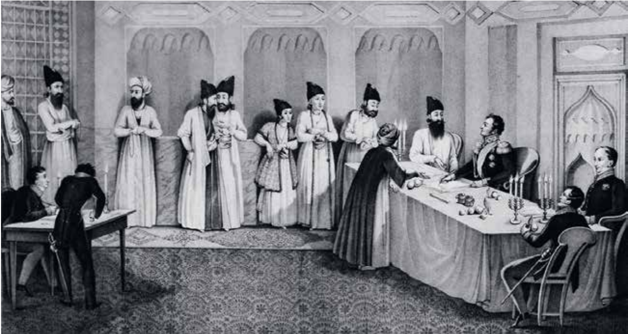
Подписание Туркменчайского договора. Художник В.Машков (очевидец событий)

посольстве одного из своих приближенных Назарали-хана, хорошо владевшего французским и в силу этого не сталкивавшегося с языковым барьером при общении с российскими дипломатами (5). При Назарали-хане состоял секретарь, имя которого в источниках не упоминается, но записки которого наряду с записками первого секретаря российского посольства И.Мальцова составляют важнейший источник информации о событиях вокруг посольства. Оба эти источника, дающие достаточно полную картину гибели А.Грибоедова, неоднократно переиздавались на русском и других европейских языках. Однако это не мешает армянским авторам ставить их под сомнение только потому, что содержание этих материалов расходится с армянскими интересами.