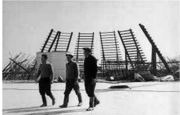
Строительство мемориального комплекса памяти жертв "геноцида армян" в Цицернакаберде в Ереване. 1966 год. Антитурецкая пропаганда всемерно поддерживалась руководством СССР

Строительство мемориального комплекса памяти жертв "геноцида армян" в Ереване. 1966 год