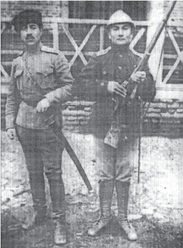
Кавалеристы азербайджанской армии

Карабахе и одновременно при прямой поддержке своих покровителей – правительств стран Антанты раскручивали на международной арене яростную кампанию против Османской империи. Утверждалось в частности, что турецкие войска из Карабаха введены непосредственно на территорию Армении, что турецкие военные, мол, в Карабахе убивают мирных армян и т.п. Вдобавок глава нового османского правительственного кабинета Ахмет Иззет-паша, не имея достаточной информации о положении дел на Кавказе, поддавался давлению со стороны зарубежных государств и 23 октября дал указание о выводе османских воинских частей из Карабаха (16). Спустя неделю, 30-го числа был подписан Мудросский мирный договор, оформивший поражение османской империи в первой мировой войне и в числе прочего оговоривший вывод турецких войск с территории Азербайджана. Естественно, что уход приданных турецких подразделений не мог не ослабить дислоцированную в Карабахе 1-ю азербайджанскую дивизию, новым командиром которой был назначен генерал-майор Ибрагим-ага Усубов (17).