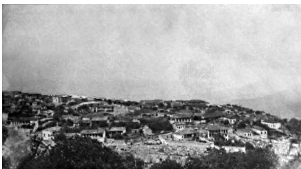
Шуша. Фотография начала XX века

Август 1905 года ознаменовал новую веху в истории армяно-азербайджанского конфликта 1905-1906 гг., положив начало ещё более кровопролитным столкновениям, охватывавшим всё новые города и уезды Южного Кавказа. Во второй половине августа в Шушинском уезде Елизаветпольской губернии вспыхнула армяно-азербайджанская резня. То, что она началась именно здесь, было не случайным. В начале XX в. Шуша превратилась в один из главных центров армянского национал-экстремизма. Как писал в 1903 г. елизаветпольский губернатор, именно в Шуше «пропаганда армянских революционеров свила себе настолько прочное гнездо, что борьба с преступной деятельностью их приобретает значение всё более и более серьёзной задачи правительства» [11, л. 6 об.]. В жандармских донесениях за 1904-й год Шуша упоминается не иначе как «место пребывания главного центрального комитета армян» [4, л. 28].