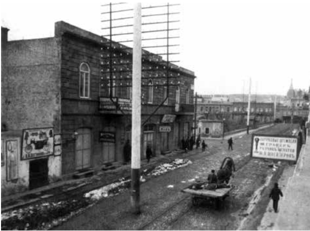
Уборка трупов на улицах Баку после армяно-азербайджанской резни

кого-то пригласить. Из этого уездный начальник сделал вывод, что стороны не спешат с переговорами и прекращением огня. М.И.Пивоваров подчёркивал, что армяне всё время требовали применения войсками оружия для их защиты, но он не соглашался, поскольку не замечал военного перевеса у азербайджанцев. В то же время он признавал, что не имел достаточных сил для жёстких мер против обеих сторон [3, л. 4 об.].