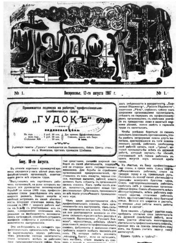
Номер газеты "Гудок" со статьей об армяно-азербайджанских столкновениях в Баку

Тем временем азербайджанцы стали принимать меры самозащиты, также начали поджигать дома противной стороны. 17 августа азербайджанцы