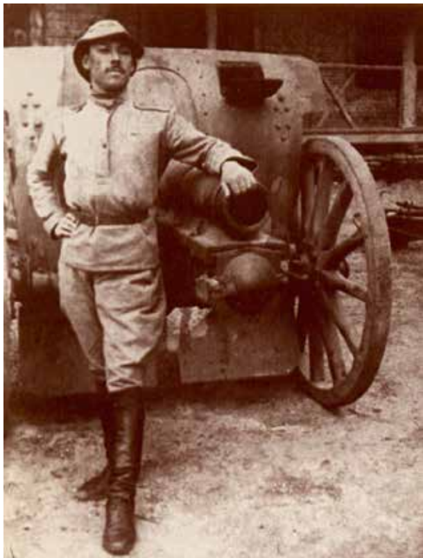
Артиллерист армии АДР

министерства стал перебазироваться обратно в Баку. Генеральный и общий штабы были размещены в здании на пересечении Красноводской и Меркурьевской (ныне – улицы Самеда Вургуня и проспекта Зарифы Алиевой) улиц (3).