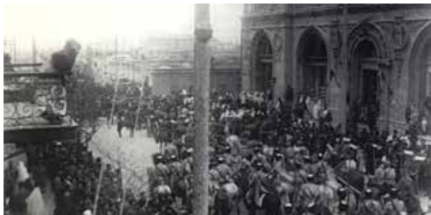
Парад частей армии АДР в апреле 1919 года в Баку за весь недолгий период ее существования.