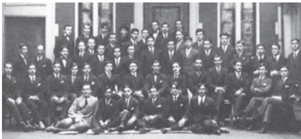
Группа азербайджанских студентов, отправляющихся на учебу в Европу за государственный счет. 1920 год

карта страны. Однако уже с самого начала азербайджанское государство столкнулось с необоснованными претензиями на Карабах и ряд других земель со стороны Армянской Республики, которая была провозглашена одновременно с АДР. На переговорах с министром иностранных дел Османской империи в Стамбуле 18 ноября 1918 года председатель парламента Азербайджана Алимардан-бек Топчубашов сказал: «Карабахский вопрос, поднятый армянами, касается не 5 или 10 деревень, он охватывает все четыре уезда: Шушу, Джаваншир, Джебраил и Зангезур. Эта территория принадлежит только одной нации, и хотя количество мусульман и армян не равно, нет оснований говорить о господстве армян, потому что они не являются коренными жителями этих мест. Это те, кто переехал в наш регион из Турции после войны с Россией... Наконец, армяне не живут в самом Карабахе отдельно, они образуют смешанные поселения с азербайджанцами. Тем не менее, мы выступаем за мирное урегулирование проблемы».