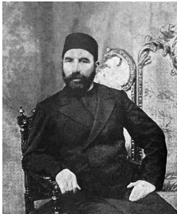
Гаджи Зейналабдин Тагиев

Баку и начала продвижения к Гяндже военных сил Бакинского совета школа приостановила свою деятельность, а личный состав и курсанты отправлены на фронт. Школа возобновила работу с прибытием в Гянджу частей турецкой «Кавказской исламской армии» (11).