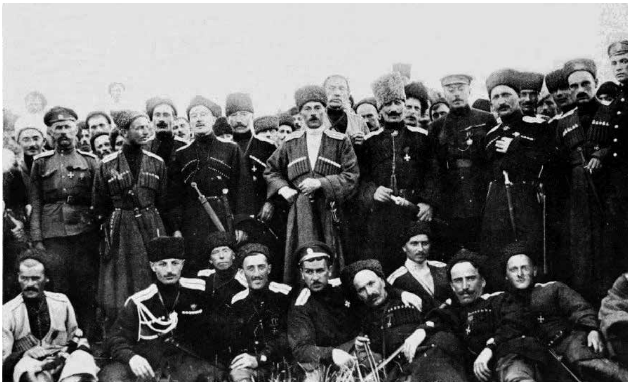
Офицеры Татарского конного полка

этих подразделений. С другой стороны, общая сложная обстановка серьезно затрудняла работу, в первую очередь это касалось снабжения и комплектации личного состава. Сам А.Шихлинский позже писал, что начинали работу фактически с нуля: не было оружия и боеприпасов, продовольствия, одежды и обуви (5). В то же время патриотически настроенная молодежь всячески помогала делу военного строительства: есть даже свидетельства, что многие студенты-азербайджанцы бросали учебу в России и приезжали на родину для того, чтобы записаться в молодую национальную армию, а некоторые привозили с собой оружие (6).