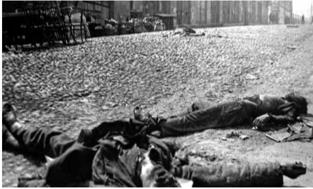
Жертвы геноцида. Баку, март 1918 года