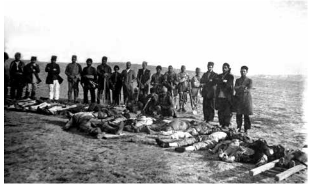
Похороны жертв геноцида. Баку, апрель 1918 года