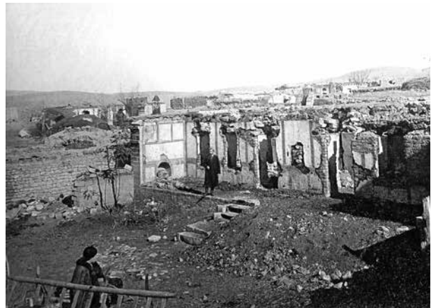
Разгромленное селение Мерзендиге