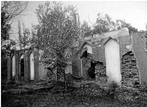
Город Агсу. Руины разгромленной мечети