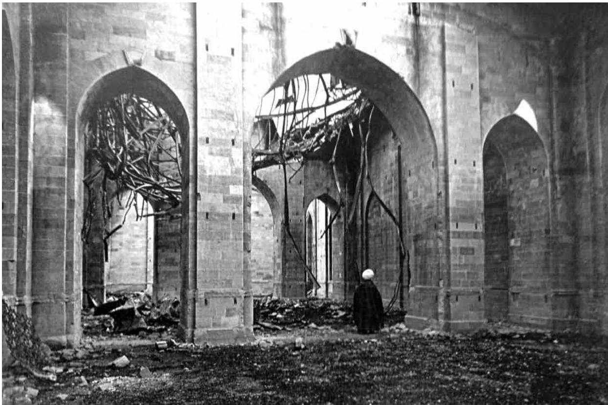
Руины старейшей на Кавказе пятничной мечети в Шемахе. На фоне руин – ахунд Гаджи Ших Габиб