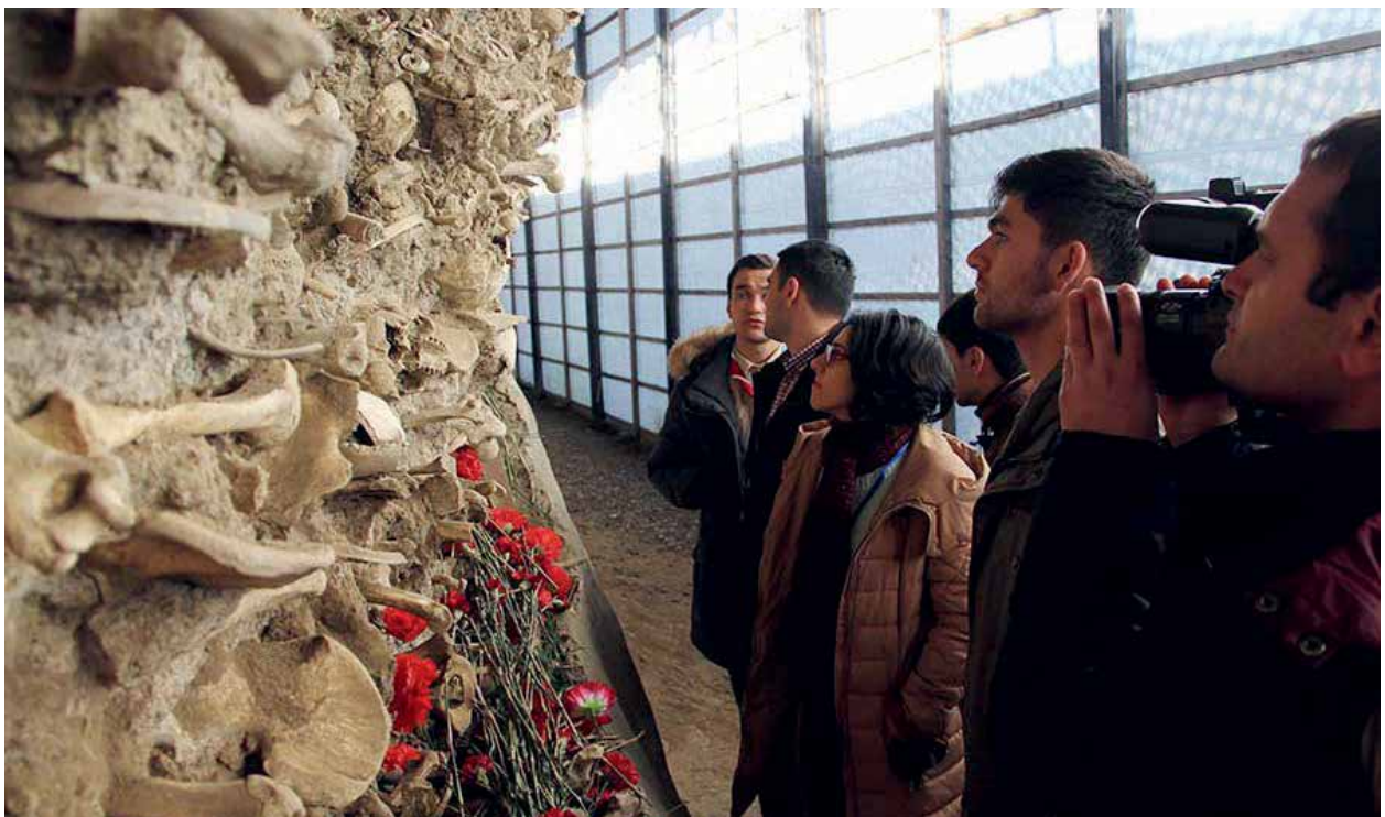
Останки убитых азербайджанцев, обнаруженные археологами в коллективной могиле на берегу реки Гудиялчай. г.Губа. Губинский мемориал жертв геноцида