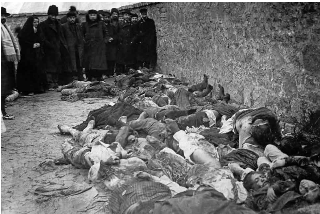
Жертвы геноцида. Баку, март 1918 года