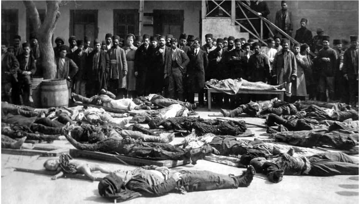
Жертвы геноцида. Баку, март 1918 года