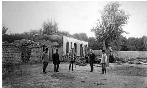
Город Шемаха. Дом Мехтиевых. Члены ЧСК осматривают останки мальчика, заживо сожженного армянскими боевиками