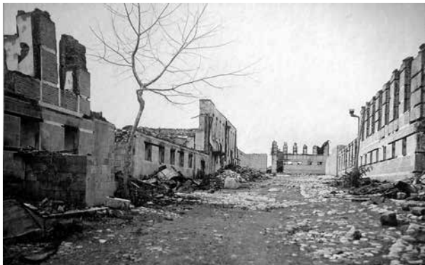
Город Шемаха, Шихминасская улица. Сожженные дома знатных азербайджанцев Исмаиловых и Зейналовых