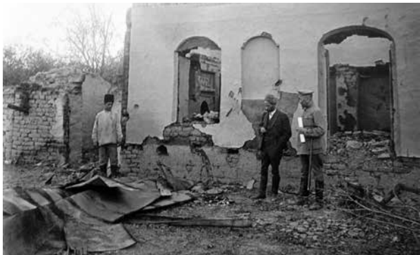
Город Шемаха. Дом Мехтиевых. Члены ЧСК осматривают останки пожилого члена семьи, заживо сожженного армянскими боевиками