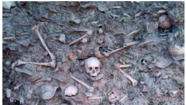
Останки убитых азербайджанцев, обнаруженные археологами в коллективной могиле на берегу реки Гудиялчай. г.Губа. Губинский мемориал жертв геноцида