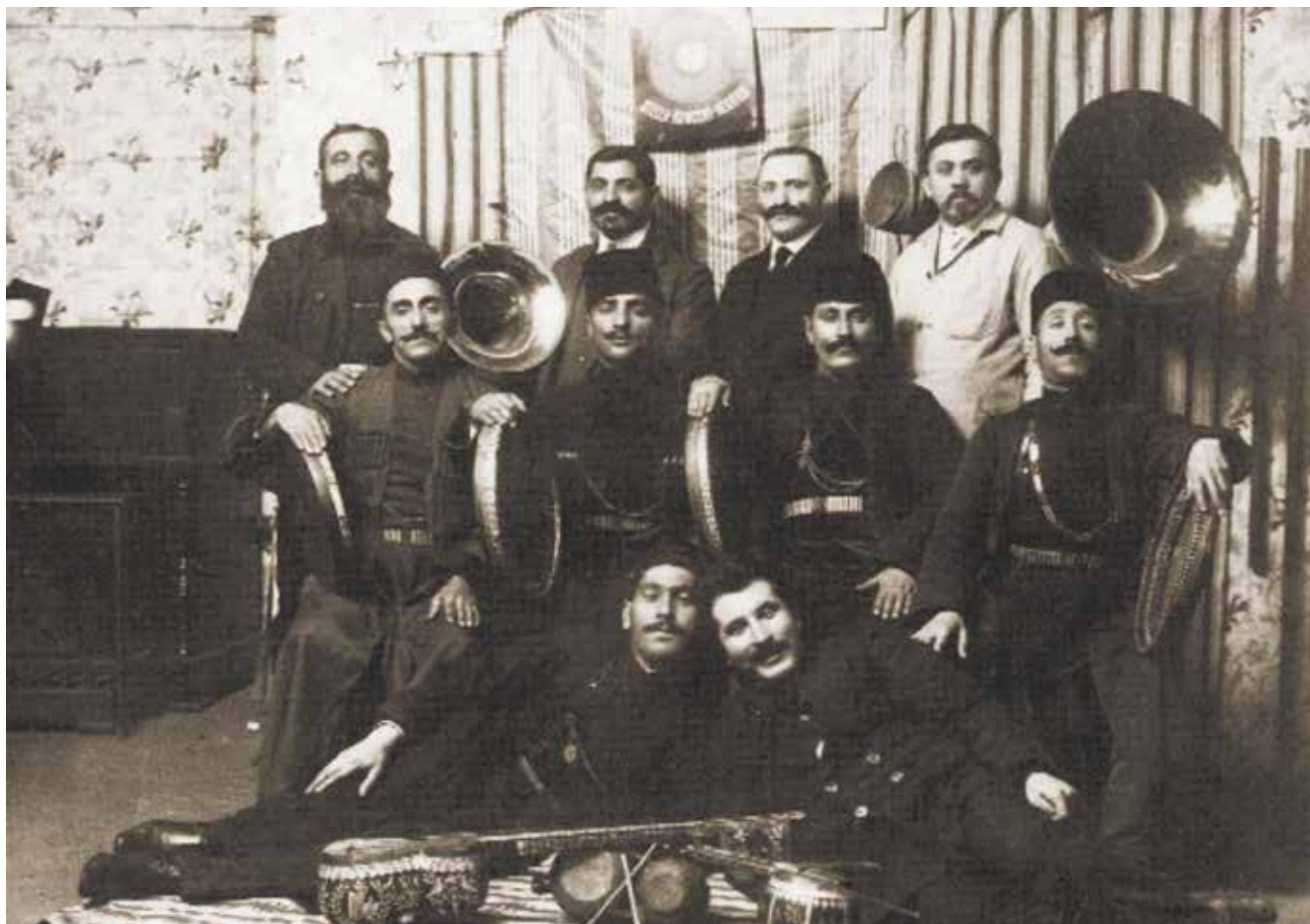
Граммoфон валдарына әзербайжан халық әуендерін жазып жатқан әзербайжан музыкалық ансамблі. Варшава, 1914 жыл

Дюзю» тауы да көптеген атақты әншілердің өнеріне куә болды. Шuшалық балақайлар бұл табиғаттың кереметімен дауыстарын мың құбылтып, жаңғыртып мүмкіндігінше ойната білді. Осындай әсем табиғатты, жапырақтардың сыбдырын, бұлақтың сыңғырын, құстардың сайрағанын, қайталанбас жаңғырықтарды тек бала қиялы ғана суреттей алатындай еді.