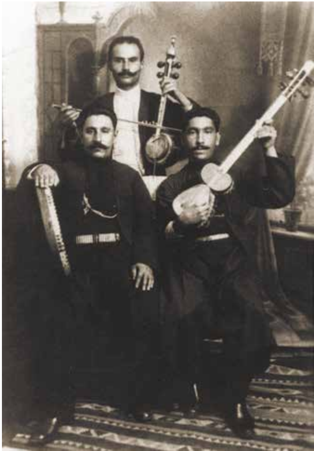
Мұғам триосы. XIX ғасыр соңындағы фотосурет

жүйеде қалыптасқан мұғамдар көптеген батыс пен шығыс елдерінің оркестрларында керемет жетістікпен орындалып жүр. Дегенмен, заманауи композиторлардың интерпретациясы мен шығармашылық ізденістері үшін мұғам кеңістігі, шын мәнінде, нағыз қайнар көз болып табылады. Ал мұғам білгірі оны кез-келген шығармаларда, яғни, мұғамнан басқа өлеңдерде де пайдасына жарата алады.