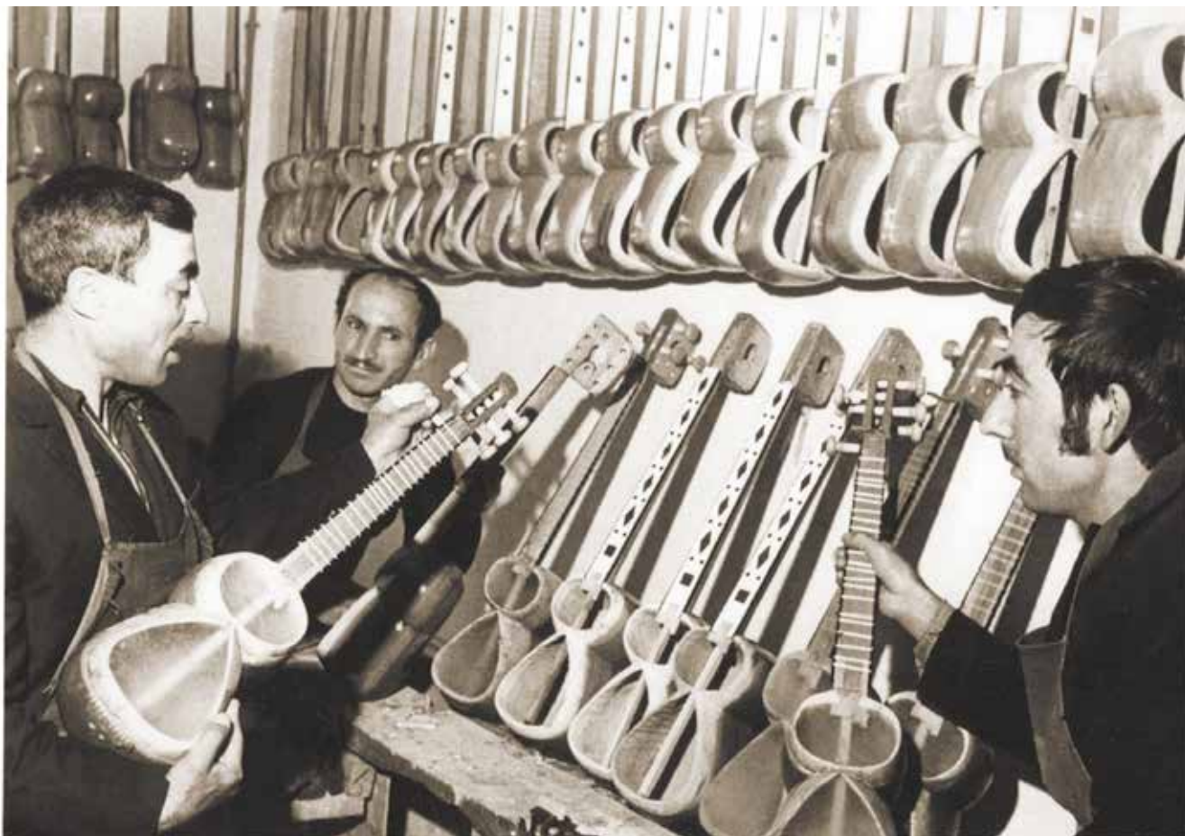
Армения күштері Қарабахты басып алмай тұрып Ағдамда әзербайжан ұлттық аспаптар фабрикасы істейтін. 1980 жылдардың ортасындағы фотосурет

– Қарабах тақырыбын тудырды. Атақты мұғам «Қарабах шикястеси» Қарабах әншілерінің өзіндік төлқұжаты болған әрі солай боп қала да бермек.