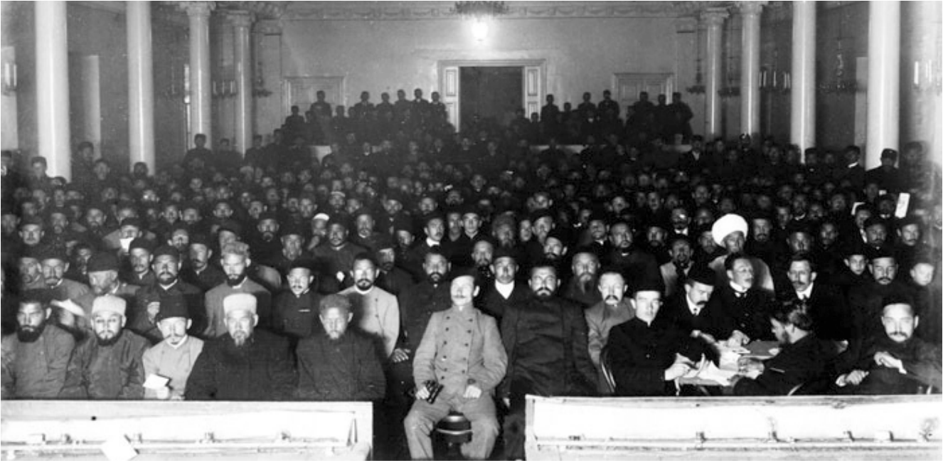
Rus İmparatorluğu Müslümanlarının kongrelerinde Azerbaycanlı milletvekilleri aktiftiği ile seçiliyordu

Bakü Komitesi bünyesinde Azerbaycanlılardan oluşan bir teşkilat kurmaya karar verdi. Rusya'dan gelen işçilerle birlikte çalışan Azerbaycanlı işçiler de devrim hareketi-