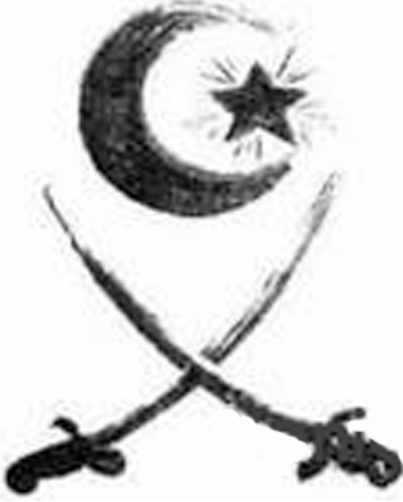
“Difai” teşkilatının amblemi

A zerbaycan'ın yakın tarihinin incelenmesi birçok açıdan önemlidir. Her şeyden önce, bölgenin Rusya Çarlığı tarafından istila edilmesi ve daha sonra da Sovyetler Birliği'nin bir parçası olduğu zaman yaşanan çok ilginç tarihi dönemler unutturulmaya çalışılmış ve yerine siparişli milli tarih yazılmıştır. Gerek çarlık döneminde, gerekse Sovyetler Birliği'nde yaşamış Azerbaycan halkının ulusal bağımsızlık için vermiş olduğu mücadeleleri araştırırken, sıradan insanların kendi milleti ve devleti için fedakarlıklar yaptığından ve bu mücadelelerin gelecek nesiller için bir örnek oluşturduğundan emin oluyorsun. Özellikle, Sovyet yönetimi döneminde Azerbaycan tarihinin belirli bir dönemi ideolojik açıdan ele alınarak bazı dönemler unutturulmaya çalışılmış, ancak bu dönemler, yabancı tarihçiler tarafın-