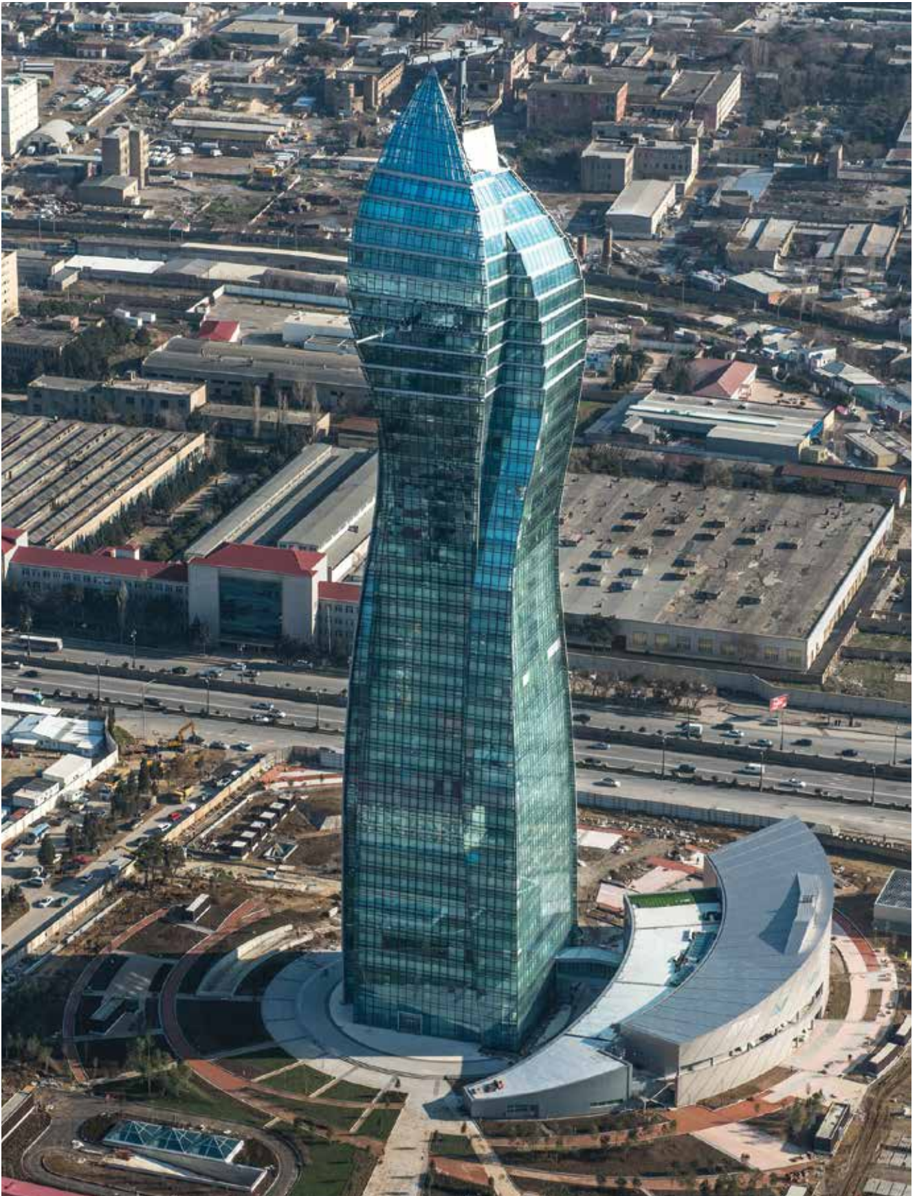
Nuevo edificio administrativo de la Compañía Estatal Petrolífera de la República de Azerbaiyán (siglas en inglés: SOCAR)