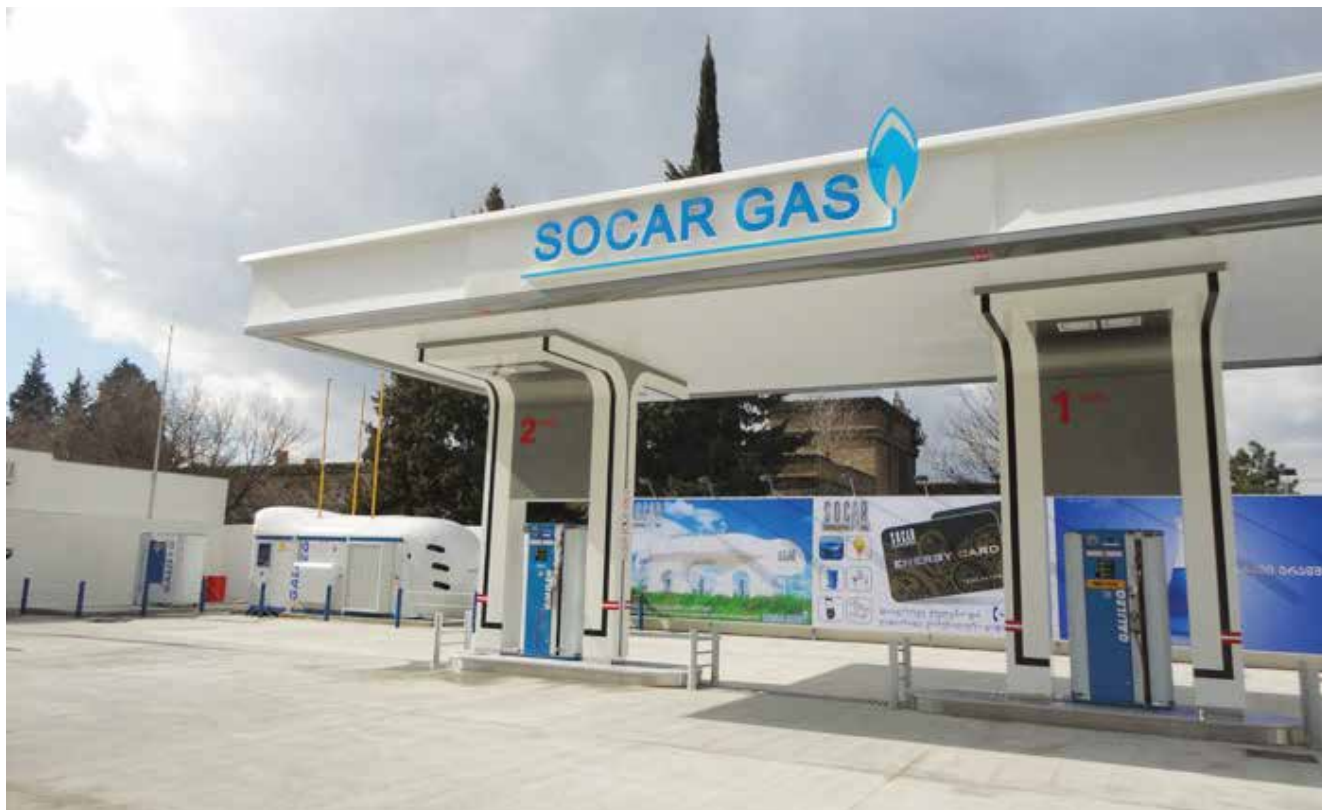
Una de las numerosas estaciones de servicio de SOCAR