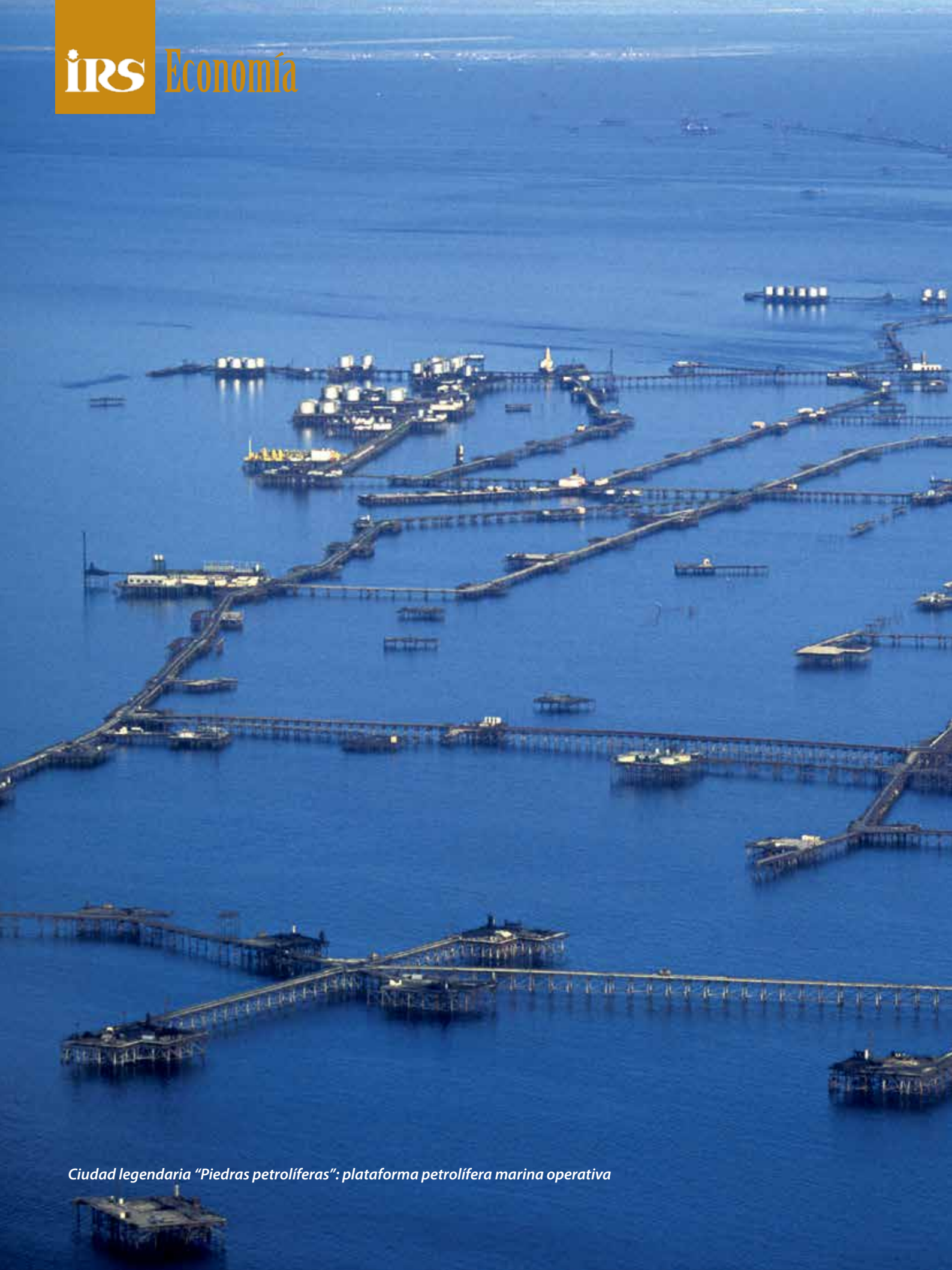
Ciudad legendaria "Piedras petrolíferas": plataforma petrolífera marina operativa