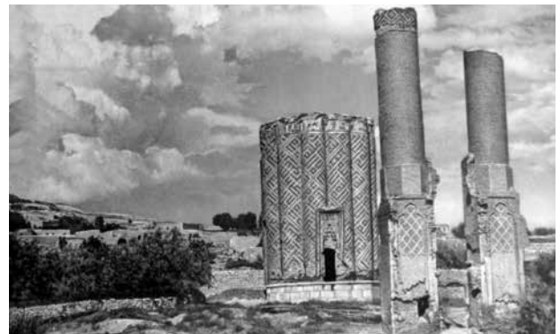
Комплекс Карабаглар. Начало XX века

относится к жемчужинам зодчества не только Азербайджана, но и всей Передней Азии. Судя по всему, это один из архитектурных ансамблей мемориально-благотворительного назначения, состоявших из дворца, мечети и медресе, ханегяха, лечебницы, бани и пр., которые активно строились в эпоху династии Ильханидов. Доминирующим элементом такого ансамбля служило здание мавзолея (4). Архитектурные черты и особенности мавзолея позволяют сделать вывод, что он возведен зодчим Ахмедом Нахчивани, одним из последователей школы известного средневекового азербайджанского зодчего Аджеми Нахчивани (10, с. 11). Согласно источникам и по мнению специалистов, минареты выстроены в конце XII – начале XIII вв., портал между ними в XIV веке, а сам мавзолей – в 1332-1337-е годы (2, с. 48; 5, с. 57), при хане Абу Саиде Бахадуре из династии Хулагидов (1319-1335). Отметим, что, по мнению большинства азербайджанских ученых, на связывающем минареты портале выбито имя супруги основателя государства Ильха-