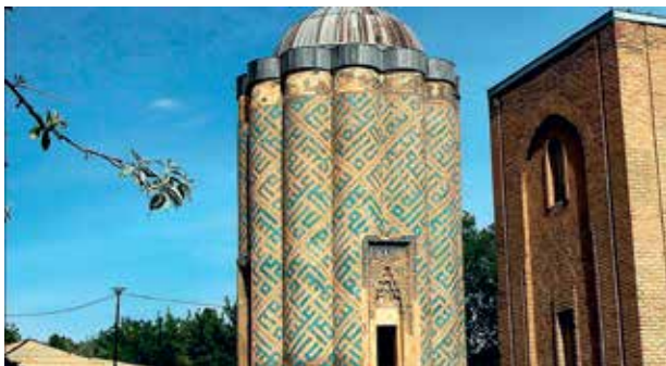
Комплекс Карабаглар. Современное фото

Так, летописец XV века Низамеддин Шами , сопровождавший эмира Тимура в его походах, в своем труде «Зафер-наме» («книга побед») описал пребывание знаменитого завоевателя в Карабагларе по возвращении из похода в Индию: «Вернувшись из Индии в столицу Самарканд, эмир Тимур получил известие о насилиях, чинимых грузинскими и армянскими солдатами в Иране, особенно в крае Азербайджана и по соседству с ним, и о нанесенном от сего простонародью ущербе. Ввиду таких событий, задевающих его честь и достоинство, светлейший эмир в 802 году (т.е. 1399-1400 гг.) выступил в поход на Хорасан, миновал Султанийе и достиг тебризского Карабаглара, где остановился с армией и покрыл пустыню шатрами и знаменами, провел смотр войск и раздал бойцам провизию...» (15, с. 13). Эту информацию спустя три столетия подтвердил Э.Челеби: «Лишенный света Тимур с большой армией пять месяцев оставался на зимовье в Карабагларе».