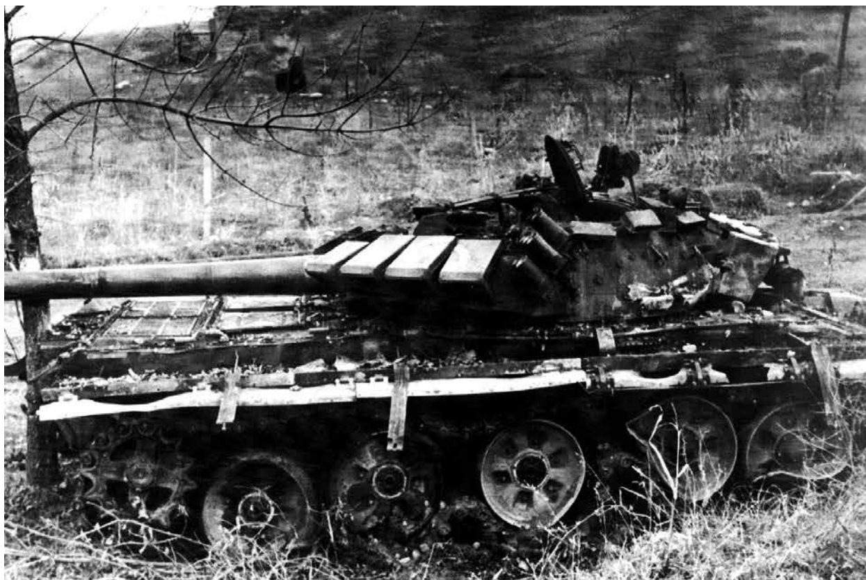
Уничтоженный в бою армянский танк