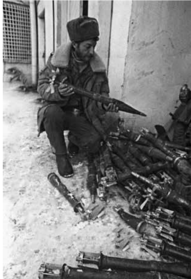
В каждом освобожденном от армянских оккупантов селе брались богатые трофеи в виде оружия, боеприпасов и снаряжения

10 декабря на бейлаганском участке фронта армянские силы в очередной раз активизировались и предприняли попытку продвинуться дальше вглубь Азербайджана. Для этой операции противник стянул дополнительные части и военную технику. Уместно заметить, что лето и начало осени 1993 года отмечены крупными поражениями Азербайджана: в условиях воцарившегося в стране внутривластного хаоса Армения захватила обширные территории не только нагорного, но и низменного Карабаха. Но на этот раз армянская сторона, планировавшая еще более расширить военную экспансию,