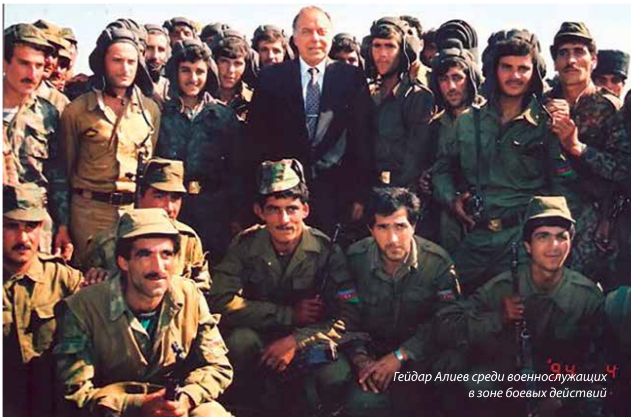
Гейдар Алиев среди военнослужащих в зоне боевых действий

ших в обширном регионе. Говоря о так называемой «апрельской войне» прошлого года - контр наступательной операции, проведенной в ответ на диверсионную вылазку армянских войск на линии фронта, президент Азербайджана Ильхам Алиев