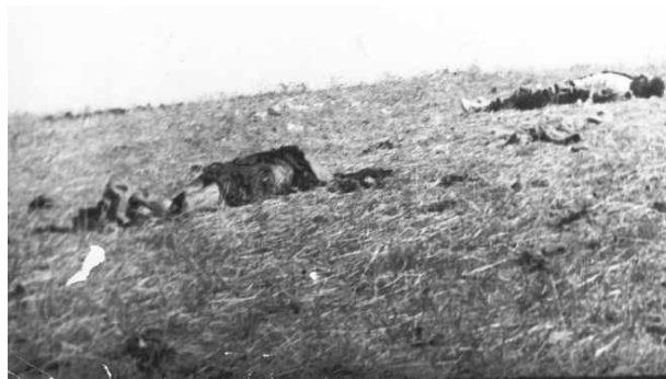
Убитые армянские солдаты у села Куйджак

Тем не менее, уже наутро, 17-го армянская сторона сделала попытку прорвать оборону азербайджанской армии на бейлаганском направлении , выставив против лишь одной из азербайджанских частей 6 танков и 2 БМП. Вблизи села Курд-Махмудлу армянские войска в общей сложности 12 раз шли в атаку, но потерпели неудачу и отошли назад. Азербайджанская армия, измотав противника в кровопролитных оборотах, оставила Азербайджанский солдат на позиции