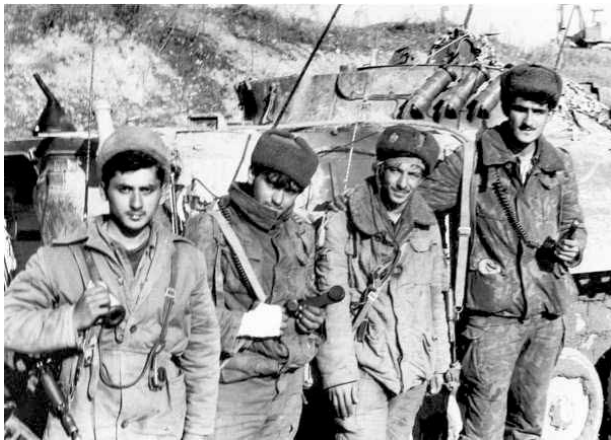
Группа солдат азербайджанской армии в Физулинском районе

нительных боях, предприняла контрнаступление, освободив села Ашагы-Яглывенд, Шукурбейли и Керимбейли, поселок Горадиз Физулинского района. Армянские части отступали в явной панике, бросив на поле боя 8 танков, 12 противотанковых устройств, 6 бронированных прицепов, 7 орудий, 3 автомобиля и большое количество боеприпасов. В ходе заключительных боев на данном участке фронта армянская армия потеряла в общей сложности до 500 человек личного состава, 32 танка, 7 БМП, 5 автомобилей, 10 орудий и 6 минометов. Кроме того, обезврежено более 3 тыс. мин, заложенных армянскими военными (4).