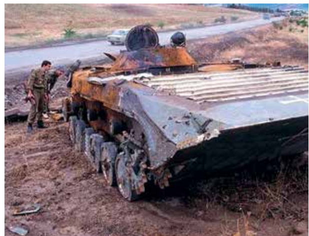
Уничтоженный армянский БМП

натолкнулась на сокрушительный контрудар обновленной азербайджанской армии. Только 11 декабря противник потерял 7 танков, 3 БМП и до 200 человек живой силы. Этот успех Азербайджана стал началом перелома в карабахской войне (1). 13 декабря в ходе боев на физиулинском и