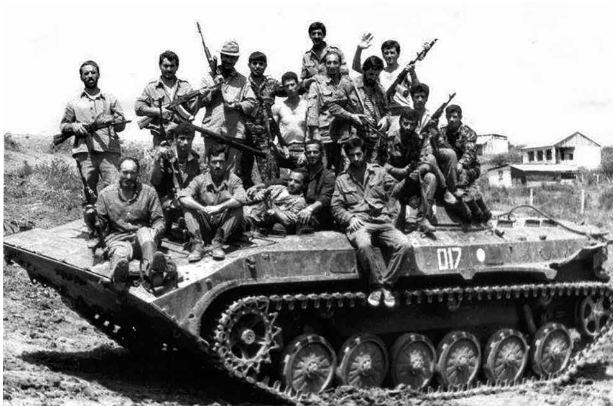
Азербайджанские войска в освобожденном от врага поселке Горадиз