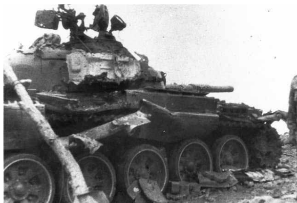
Уничтоженный армянский танк на перевале Омар