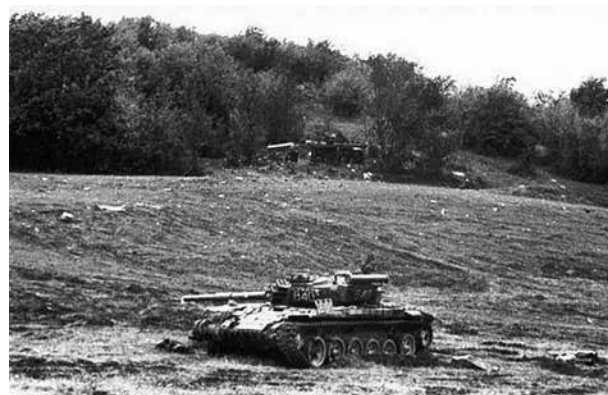
Подбитый армянский танк

Однако и сегодня еще Армения продолжает игнорировать четыре резолюции Совета безопасности ООН о безусловном освобождении всех оккупированных территорий Азербайджана и восстановлении его международно-признанных границ, торпедирует все шаги по урегулирова-