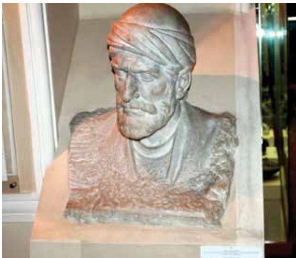
Бюст Аджеми Нахчывани в Национальном музее истории Азербайджана

Следует отметить, что в дальнейшем на мусульманском Востоке было воздвигнуто немало ценных