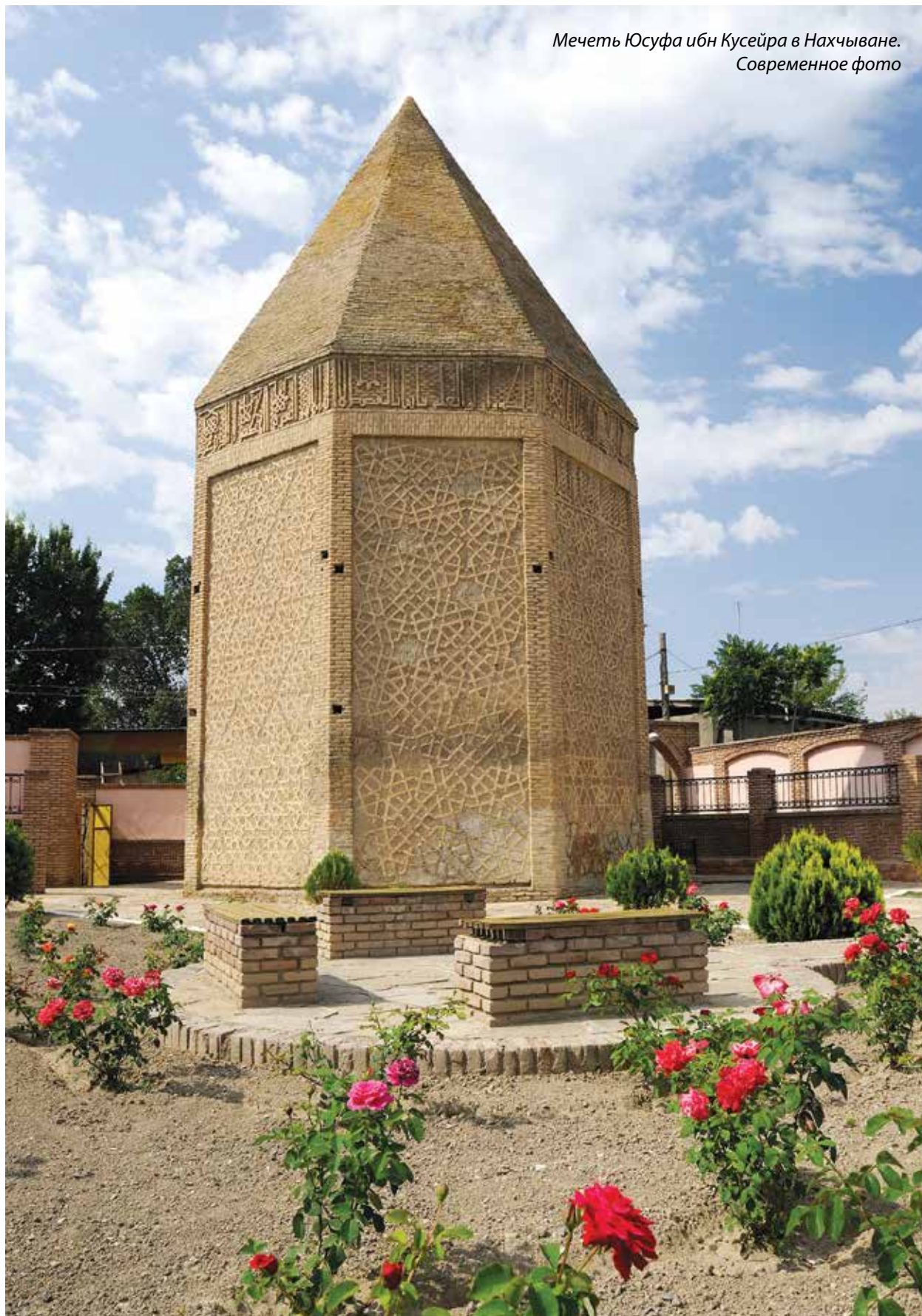
Мечеть Юсуфа ибн Кусейра в Нахчыване. Современное фото