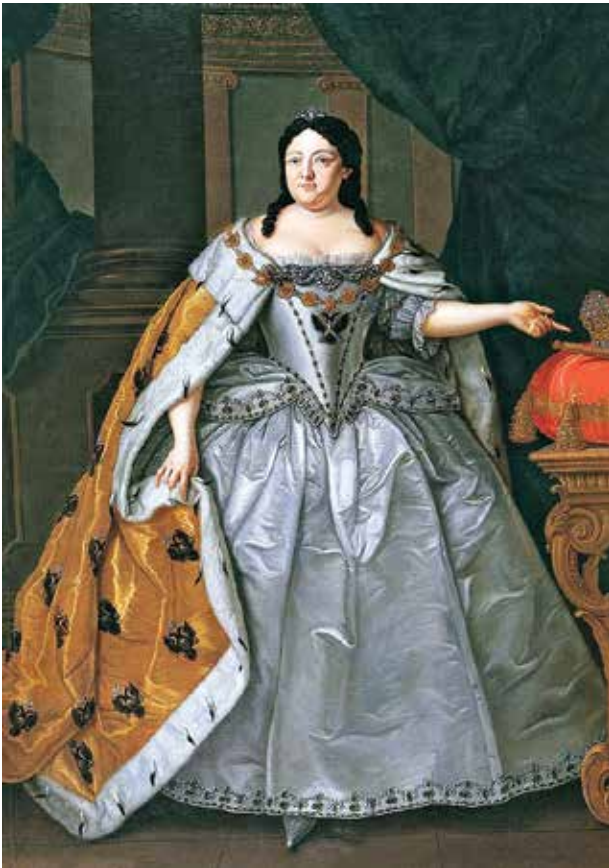
Коронационный портрет императрицы Анны Иоанновны

власти несколько провинций Хорасана. Согласно данным источников, именно в это время, в 1726 году 37-летний Надир Гулу бек поступил на службу к шаху Тахмасибу II (прим.2) под именем Тахмасиб Гулу-хан. «8 сентября (1726 г.), - сообщает Аврамов, - прибыл в Качан [Кучан-Хабушан] авшарец Надыр-Кулы-бек при котором было войск конницы и пехоты тысяч пять... которому шах... ранг переменял и назвал Тахмас Кулы-ханом » (8, л. 19-а и 19-б). После смерти в 1726 г. Фатх Али-хана Каджара (прим.3) Тахмасиб II назначил Надира главнокомандующим шахскими вооруженными силами.