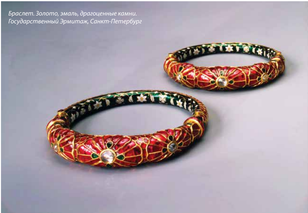
Браслет. Золото, эмаль, драгоценные камни. Государственный Эрмитаж, Санкт-Петербург

Сведений о детстве и юношеских годах Надира практически не сохранилось. Известно лишь, что во время очередного набега хорезмских узбеков он вместе с семьей был взят в плен, но вскоре бежал и, вернувшись в Хорасан, поступил на службу к правителю Абиварда Баба Али беку, приняв имя НаDIR Гулу-бек. Собрав небольшое войско, НаDIR постепенно подчинил своей