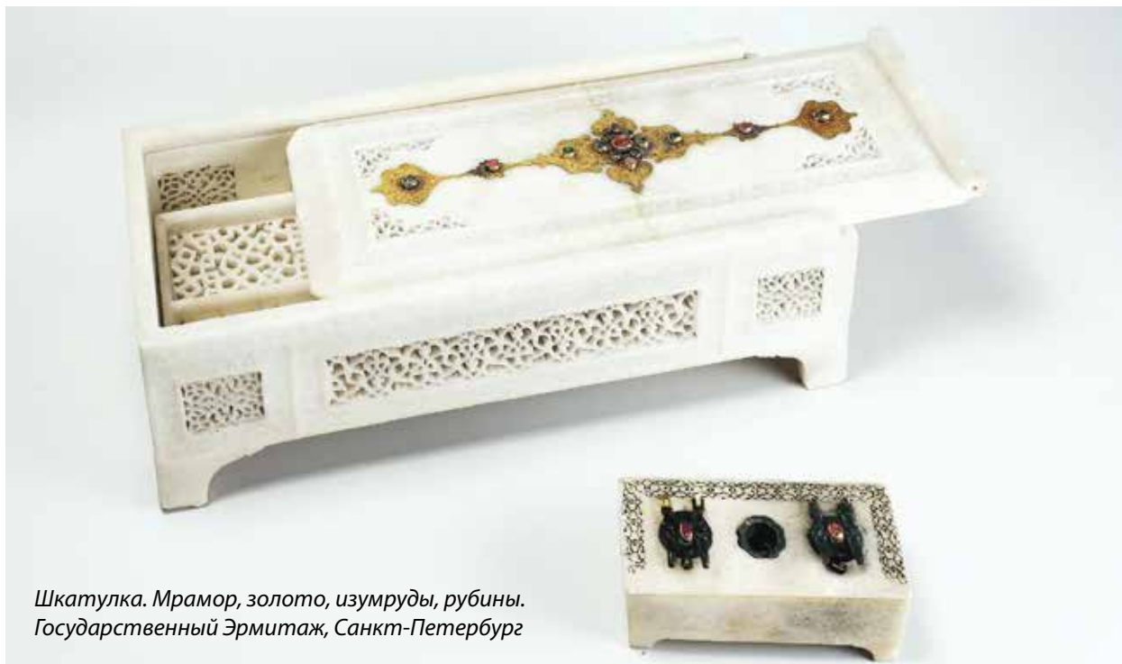
Шкатулка. Мрамор, золото, изумруды, рубины. Государственный Эрмитаж, Санкт-Петербург

В ожидании дальнейшего путешествия посольство простояло в Кизляре до августа следующего года. Наконец разрешение на путешествие посольства из Петербурга было получено. 11 сентября 1740 года Хуссейн-хан торжественно вступил в Астрахань, встреченный губернатором и войсками с надлежащей церемонией, отданием чести и пушечной пальбой» (14).