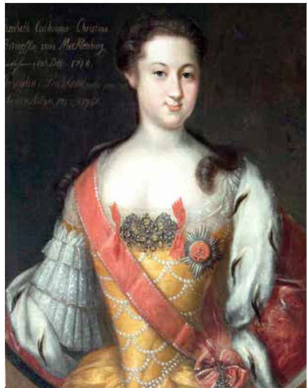
Императрица Анна Леопольдовна

и индийцами, а также в разрешении ряда спорных вопросов. В одном из источников говорится: «Как представитель могущественного монарха, похвалявшегося покорить весь мир, Хуссейн-хан ехал в Петербург с богатейшими подарками и с 14 слонами. Посла окружала нарядно одетая свита из 128 человек. ... Конечно, ни одно посольство никогда не являлось еще ко двору дружественной державы с такой значительной вооруженной силой. 9 декабря 1739 года Афшарское посольство прибыло в Кизляр, где забили тревогу. Дальше посольство не было пропущено Астраханским губернатором, князем Сергеем Голицыным, так как на этот предмет не было еще из Петербурга ника-