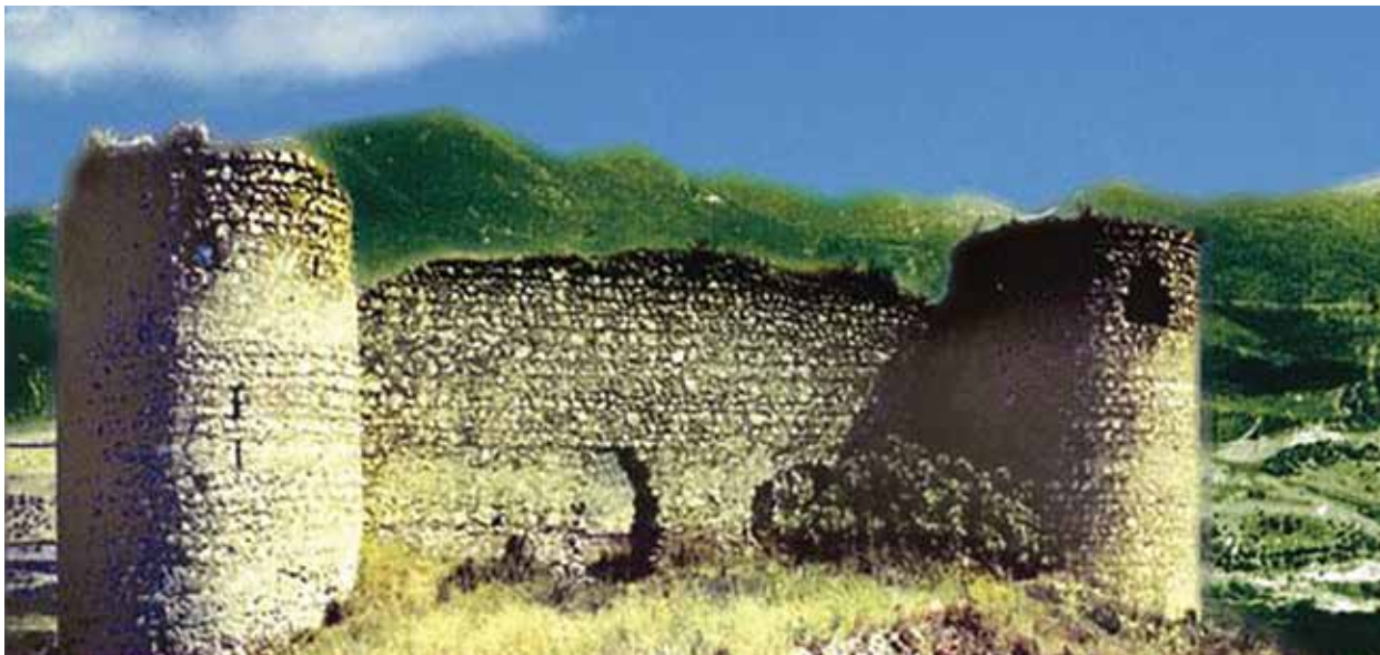
Башни и стены крепости Баят

С воцарением на иранском престоле Надир-шаха Афшара политическая обстановка в Карабахе, как и в целом в Азербайджане, изменилась коренным образом. Для того, чтобы ослабить власть карабахских беглярбеков Зияд-оглу-Каджаров, которые сохранили верность династии Сефевидов, Надир-шах вывел из их подчинения магалы