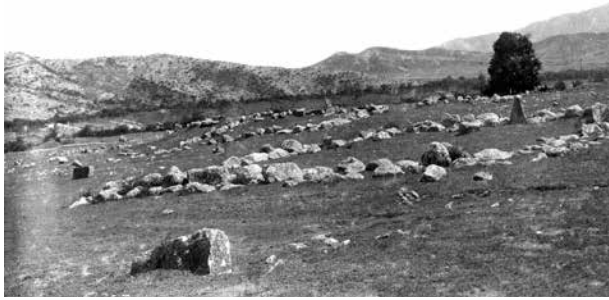
Кромлехи. Нагорный Карабах.