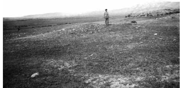
Нагорный Карабах. Ходжалы. Каменный курган до начала раскопок. 1926 г.