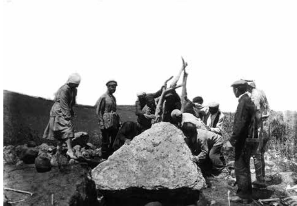
Нагорный Карабах. Ходжалы. Раскопки погребения типа «каменный ящик». 1926 г. Фото А.Алекперова

Характеризуя состояние исторической науки в 20-е годы, отметим, что в силу отсутствия местных письменных источников эпохи древности и раннего средневековья исследования по древней истории Азербайджана носили в начальный период преимущественно археологическую направленность. Археологические исследования позволили составить ориентировочную карту