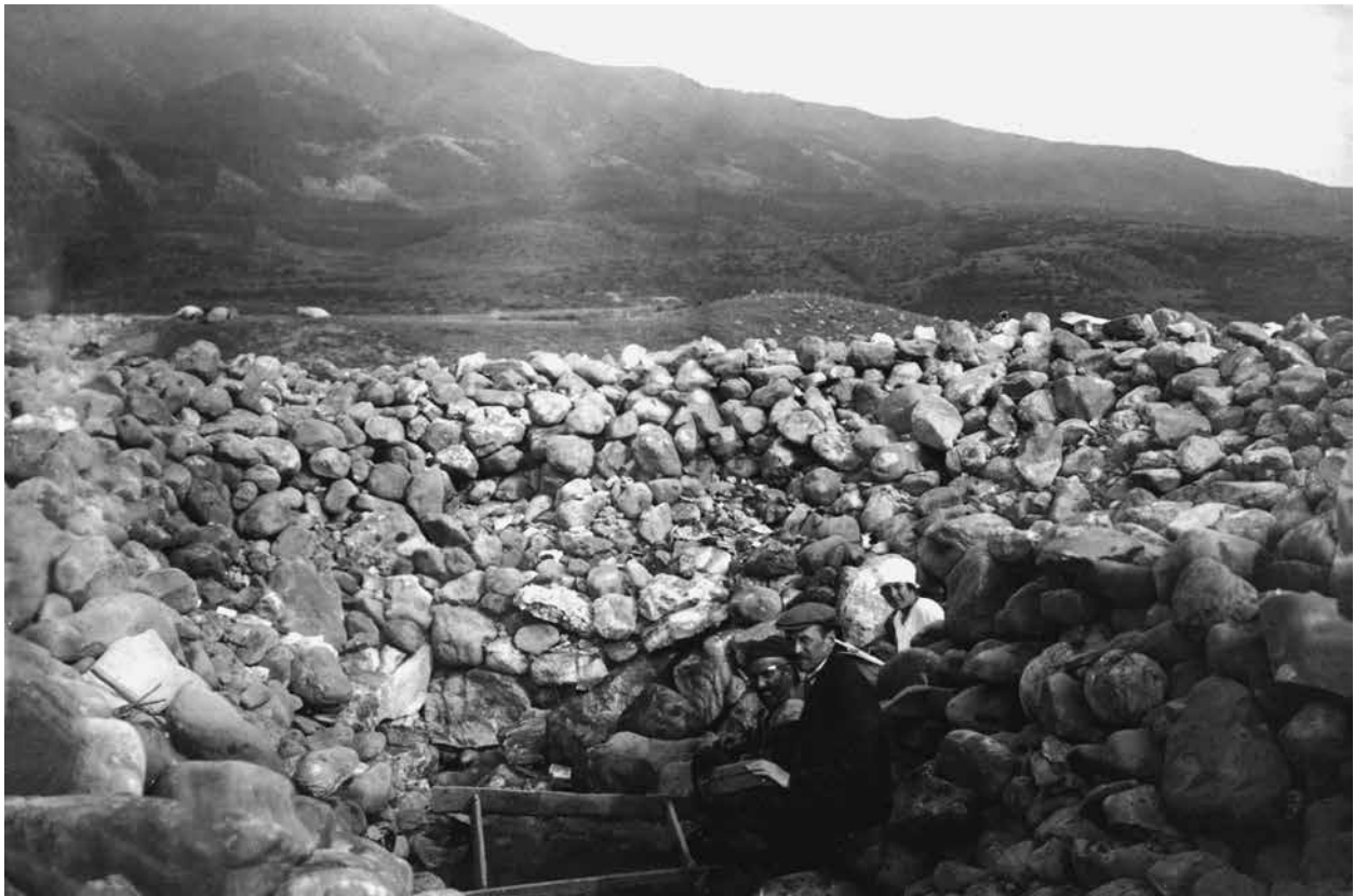
Нагорный Карабах. Ходжалы. Раскопанный каменный курган №1. 1926 г.

Весной 1936 г. советское правительство официально пригласило Б.Грозны прочесть лекции