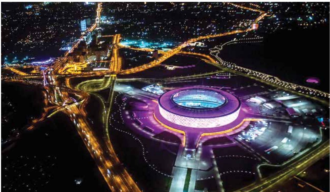
Ночные фотографии как нельзя лучше демонстрируют всю разительность перемен в Азербайджане. На фото – транспортная развязка вокруг Олимпийского стадиона в Баку

смещаясь от добычи и переработки углеводородного сырья в несырьевые сектора экономики. По прогнозу Минфина, 40,3% от привлекаемых инвестиций 2016 года пойдет в нефтегазовый сектор экономики. Именно мобилизация внешних инвестиций в нефтегазовый сектор экономики обозначена в качестве важнейшего элемента концепции развития «Азербайджан-2020: взгляд в будущее» . [2] Правительство ставит целью удвоения нефтегазового ВВП за ближайшие десять лет. Один из механизмов, стимулирующих приток инвестиций – налоговая реформа, инициируемая президентом республики и по сути переводящая страну