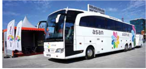
Служба ASAN имеет не только стационарные центры в городах, но и передвижные, которые обслуживают жителей самых отдаленных населенных пунктов

В чем секрет успеха «бакинского формата»? Идея руководства страны представить миру новый Баку в качестве дискуссионной площадки глобального уровня оказалась практически беспроигрышной. Минусов, за исключением организационных расходов, практически нет, а плюсы вполне конкретны. Такой формат публичных саммитов мировых знаменитостей в разных сферах позволяет поднимать статусные бренды Азербайджана по всему спектру - от экономики и дипломатии до культуры и спорта. Участие массы «селебритиз» (от celebrity — приглашенная звезда), то есть бывших и действующих политиков, международных чиновников, знаменитых ученых и деятелей искусства, известных медиа-персон привлекает внимание большого числа зарубежных масс-медиа и вызывает долговременный интерес элиты приглашенных стран к Азербайджану. А от элиты этот интерес распространяется на широкую общественность. Результат налицо - заметно улучшившаяся статистика посещений Азербайджана зарубежными высокими должностными лицами,