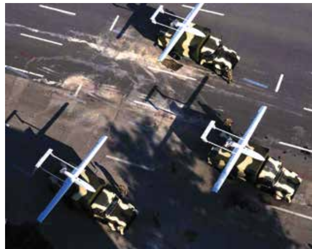
Беспилотные летательные аппараты азербайджанской армии

Умная внешняя политика: многовекторность, гибкость, предсказуемость. За десять