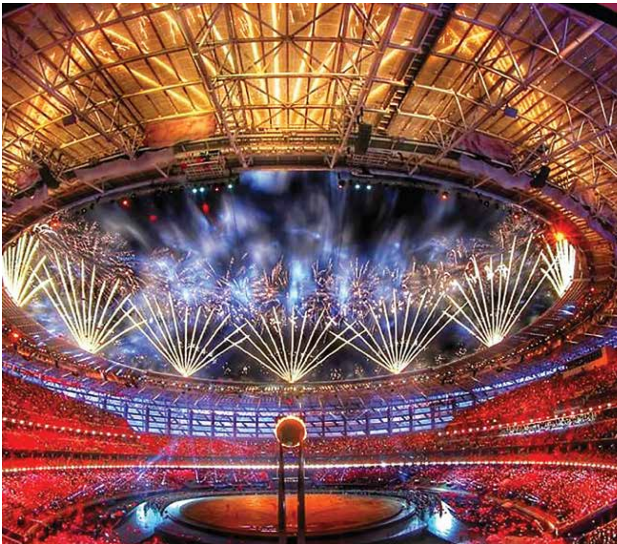
Евроигры-2015 показали, насколько масштабные мероприятия может проводить республика. На фото – церемония открытия Первых Европейских игр в Баку

совокупность национальных ценностей, особенности географического положения, состояние экономики страны, динамика социальных и политических процессов, этнических и культурных особенностей, традиций, нравов и обычаев.