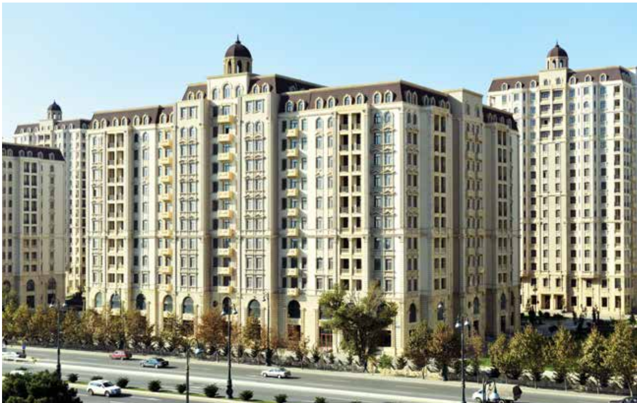
В ходе осуществления социальных программ были построены новые жилые комплексы

Казахстан – в 2 раза. В докладе Всемирного банка и Международной финансовой корпорации (IFC) Doing business-2009 о качестве государственного регулирования и его воздействии на малый и средний бизнес Азербайджан был признан мировым лидером в осуществлении реформ: улучшено 7 из