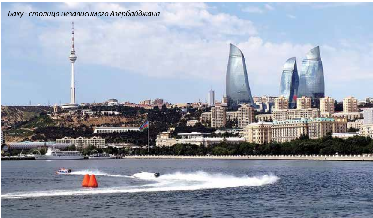
Баку - столица независимого Азербайджана

спорта стали логическим продолжением удачного старта на мировой политической арене, результатом качественного рывка в социально-экономическом развитии. Азербайджанская мозаика четверти века складывается из реализации крупных энергетических инфраструктурных проектов, выхода азербайджанской нефти и газа, а также - что не менее важно! - первых национальных брендов на мировые рынки, реформ в экономике