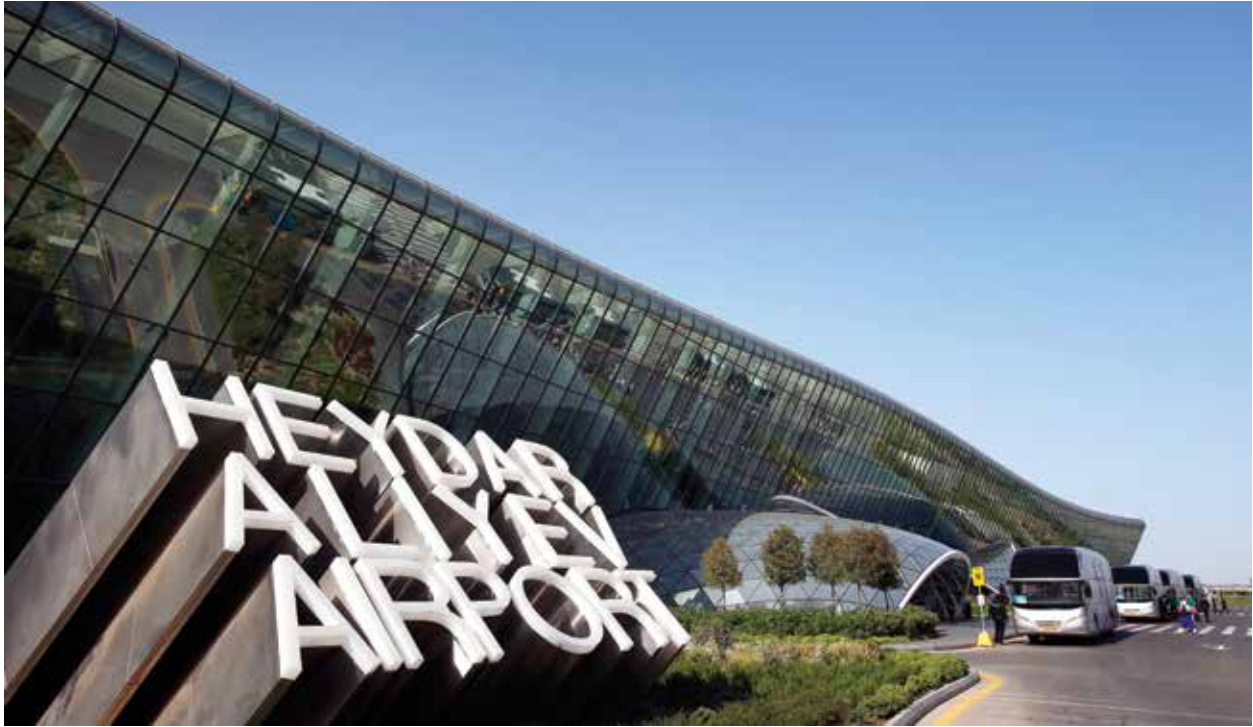
Превращение Азербайджана в крупный транспортный и логистический центр потребовало реконструкции международных аэропортов республики

и успехов в индивидуальном бизнесе, достижений во внедрении новейших технологий в экономику и госуправление, развитии высокой и массовой культуры, качественного изменения системы власти и роли государства как двигателя модернизации страны. Все это штрихи единого фундаментального процесса – выкристаллизации современной азербайджанской политической нации из плавильного котла советской общности, превращения её в важного игрока региональной и международной политики.