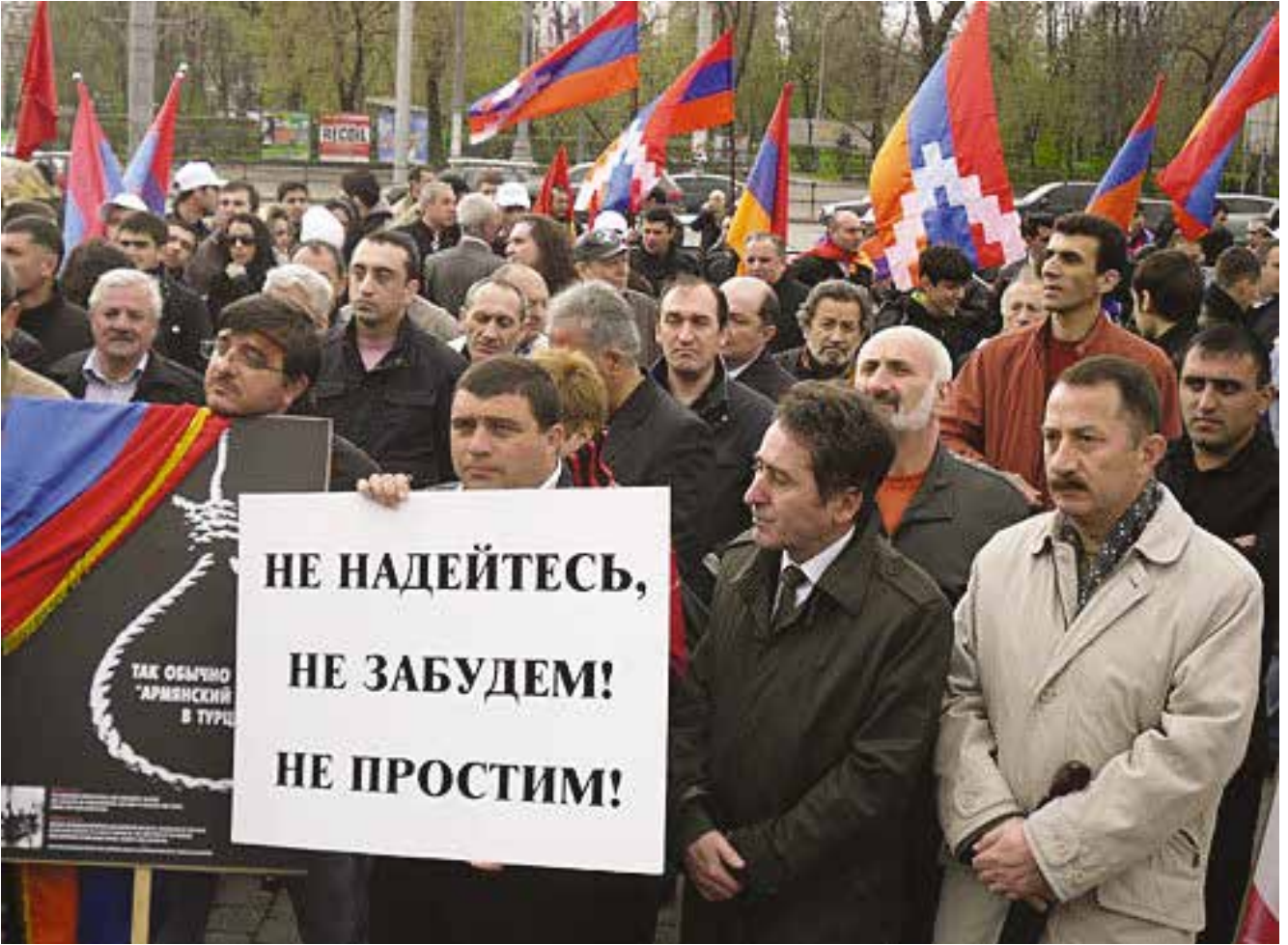
Ermeni diasporası da tüm dünyada sözde “1915 Ermeni soykırımına” ilişkin etkinlikler düzenlemektedir. Posterdeki yazı: “Unutacağımızı beklemeyin. Affetmeyeceğiz!”