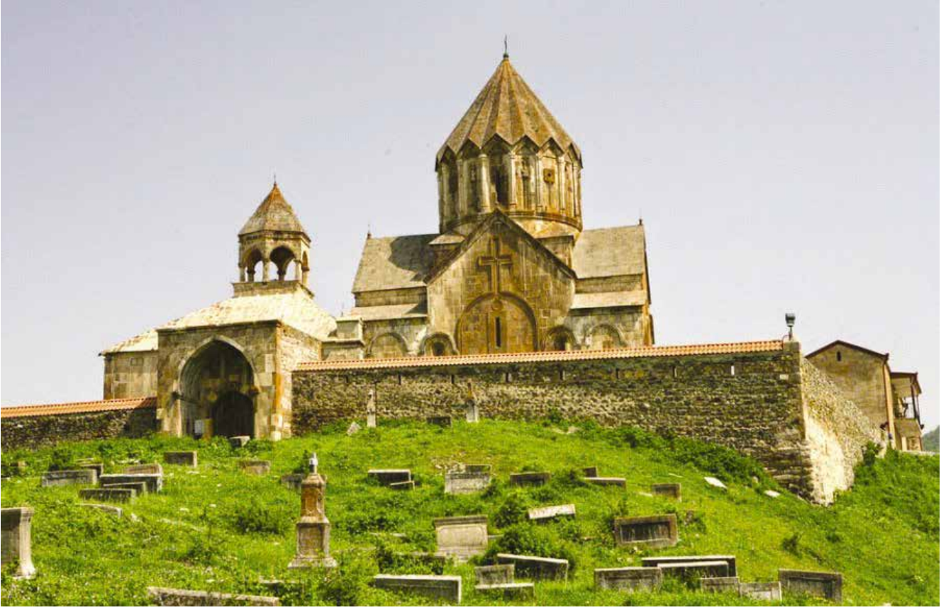
Karabağ'da Gandzasar Alban manastır külliyesi. Bugün Ermeni silahlı kuvvetleri tarafından işgal edilmiş durumda

dikkate alındığında, Grod'un (Gord) Kutsal yazıları kendi Hun dilinde öğrenebileceği olasılığı göz ardı edilemez.