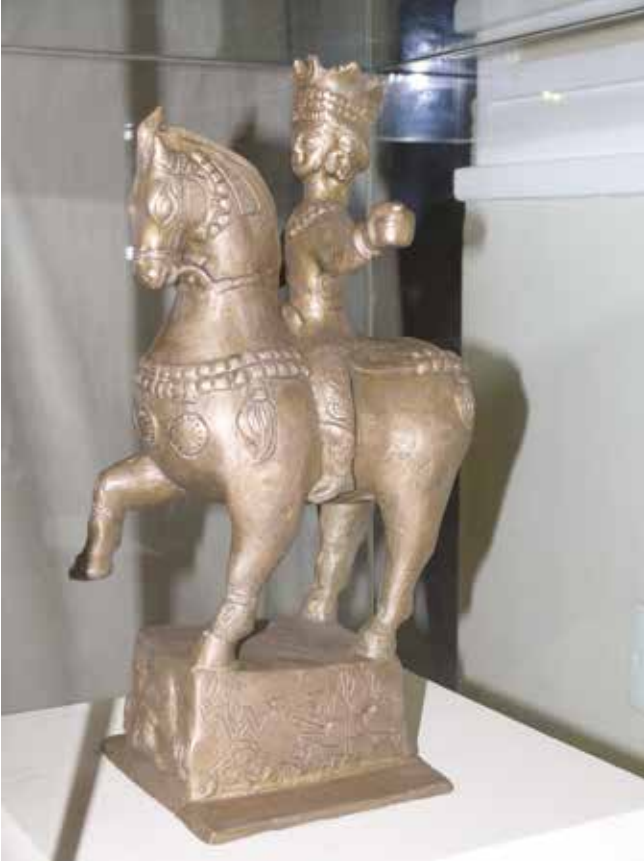
Alban Kralı Cavaşir'in bronz heykeli. VII. Yüzyıl. Nahçıvan'da bulunmuştur. Mulaj. Orijinali Ermitaj Müzesinde (St.Petersburg) bulunmaktadır

yılmamıştı. Bazı dönemlerde, sadece kral hanedanı ve onlara yakın olanlar Hıristiyan idi.