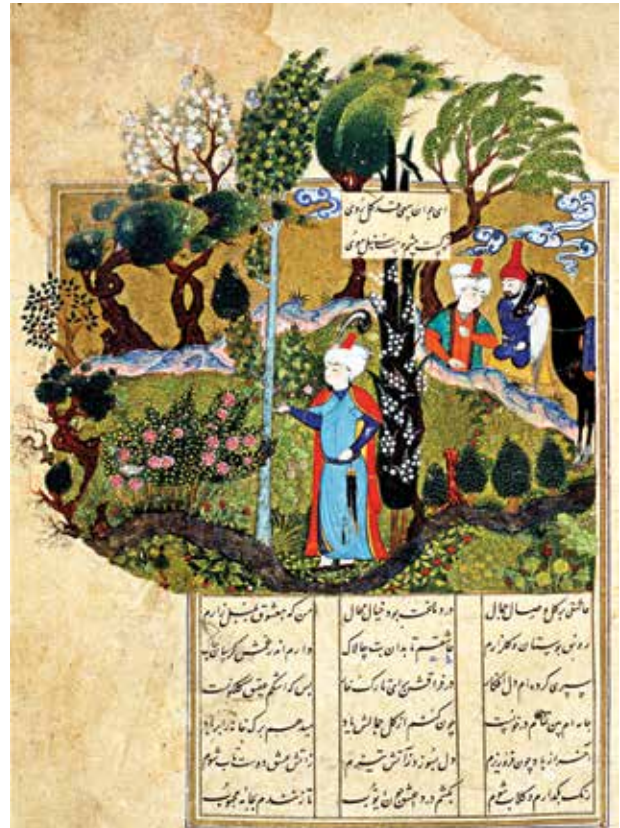
"Разговор Джалала с розами". «Сказание о Джалале и Джамале» Асафи. Тебриз

Несравненные качества миниатюрных произведений давно уже стали предметом вождения многих крупнейших музеев, библиотек и частных коллекционеров, а заодно и подлинным бедствием для истории искусства, когда отдельные рукописи расчленялись и продавались постранично на западных аукционах не только на заре рождения к ней интереса, но и в наши дни. История их злоключений сама по себе настолько захватывает, что могла бы стать сюжетом занимательной повести. В наш меркантильный век лучшим показателем художественного уровня миниатюр тебризской школы могут служить сухие сводки с торгов на престижнейших аукционах Европы. 11 апреля 2011 года на аукционе «Кристис» в Лондоне произошло событие, вызвавшее понимающий обмен взглядами присутствовавших знатоков. На торги была выставлена миниатюра «Феридун испытывает своих сыновей» из списка «Шахнаме», изготовленного для шаха Тахмасиба I. Сравнительно небольшой по размерам рисунок был продан в течение нескольких минут анонимному покупателю за 7.400.000 фунтов стерлингов. Причем тот негласный покупатель отнюдь не переплатил, более того, ему исключительно повезло: цены на средневековую тебризскую миниатюру