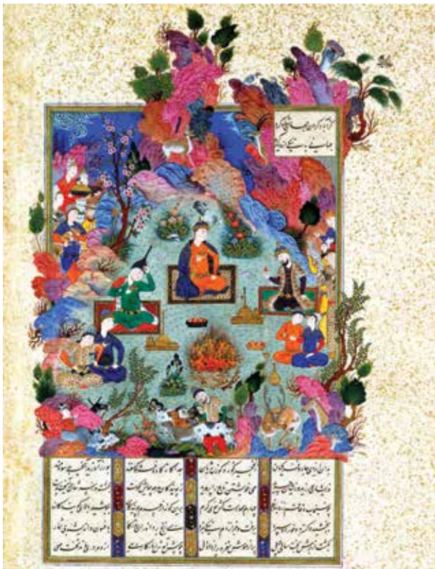
Праздник "Садех". Художник Султан Мухаммед

зрителя объекты разворачиваются ярусами вверх по листу, громоздясь друг над другом. Вполне возможно, что художник стремился таким путем подчеркнуть условность изображаемого им мира. Но в этой условности и состоит неповторимая жанровая особенность миниатюры.