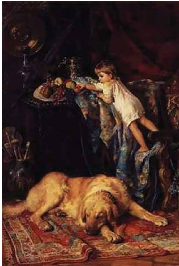
Азербайджанский ковер на картине «В мастерской художника». Художник К.Маковский, 1881

страции к сценам из поэм Низами Гянджеви "Лейли и Меджнун" и "Хосров и Ширин", сюжет "Рустам убивает белого дива" из поэмы Фирдоуси "Шахнаме", "Омар Хайям с возлюбленной" и др.