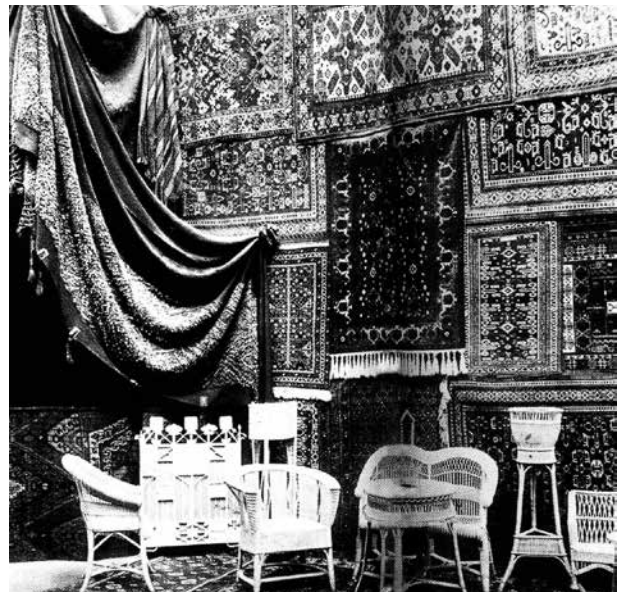
Экспозиция губинских ковров на II Всероссийской выставке, 1913 год

При сравнении ковров XIX - начала XX века из Южного и Северного Азербайджана улавливается стилистическое различие. На южных коврах тебризской, ардебильской и других школ превалирует развитие приемов миниатюрной живописи с тематикой и в стиле европейской живописи. Другая тенденция четко выражена в