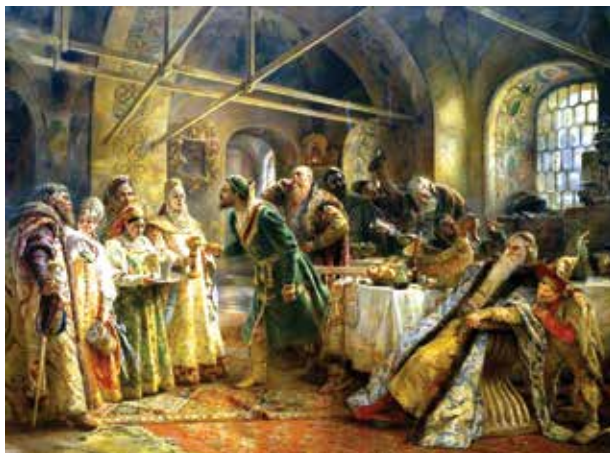
Азербайджанский ковер на картине «Поцелуйный обряд». Художник К.Маковский, 1895

В сюжетных коврах Южного Азербайджана с традиционными мотивами восточной классической литературы в большей степени сохраняются стиль и композиционный принцип, характерные для классического периода, т.е. XVI века, и одновременно ощущается влияние реалистической европейской живописи. Широкое использование литературных мотивов в ковроткачестве говорит о тесной связи между ними. Посредником в этой связи была азербайджанская миниатюрная живопись, "научившая" ковроделов XV-XVI вв. мыслению живыми образами, а высокий технологический уровень, достигнутый азербайджанскими мастерами, позволял создавать многофигурные композиции необычайной выразительности, при этом нисколько не выходя за жесткие рамки канонизированного коврового искусства. Наиболее популярными темами являются иллю-