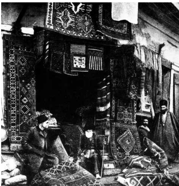
Лавка азербайджанских ковров, 1910 год

На ковровые сюжеты стало оказывать влияние реалистическое течение в живописи.