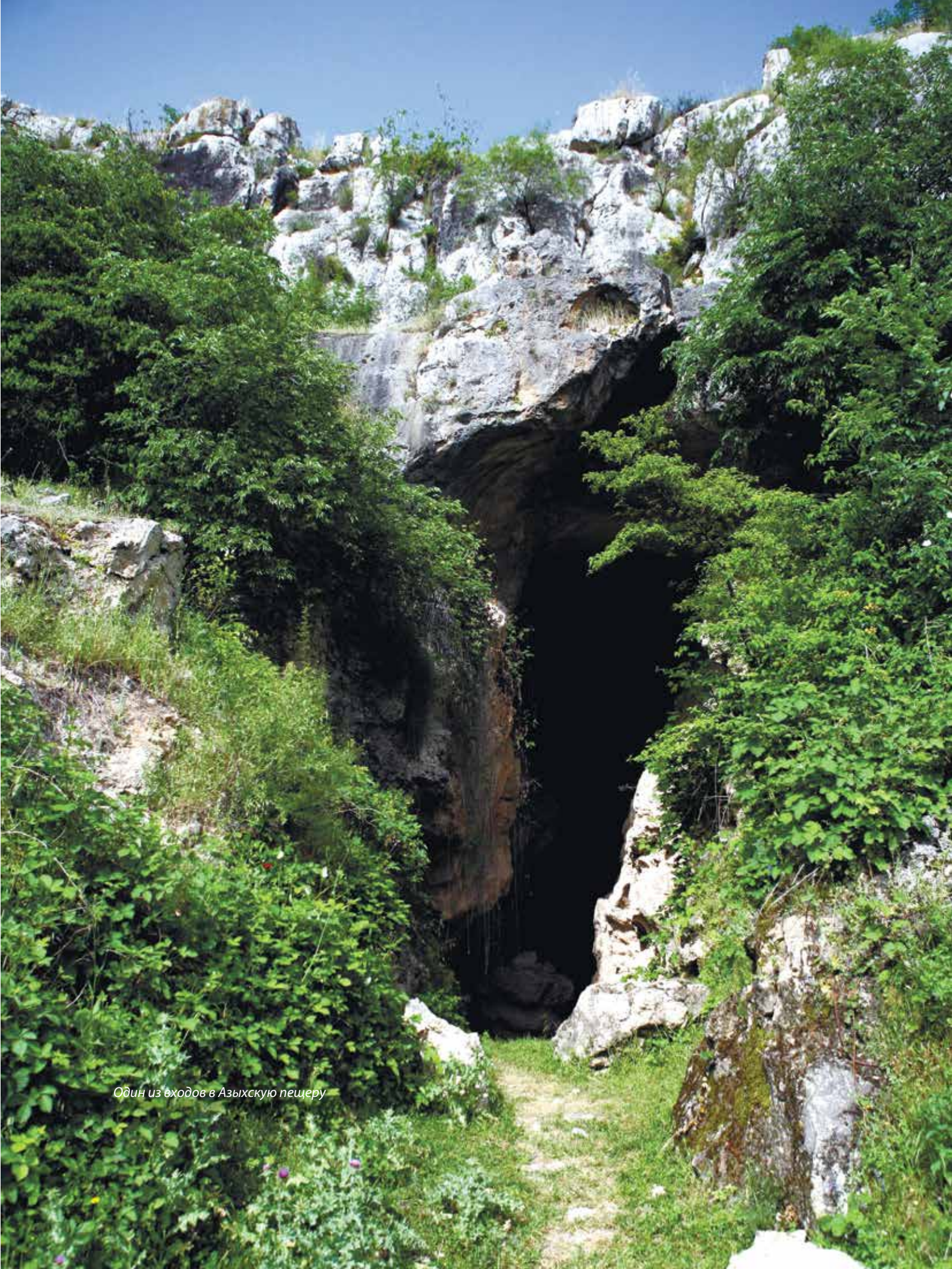
Один из входов в Азыхскую пещеру