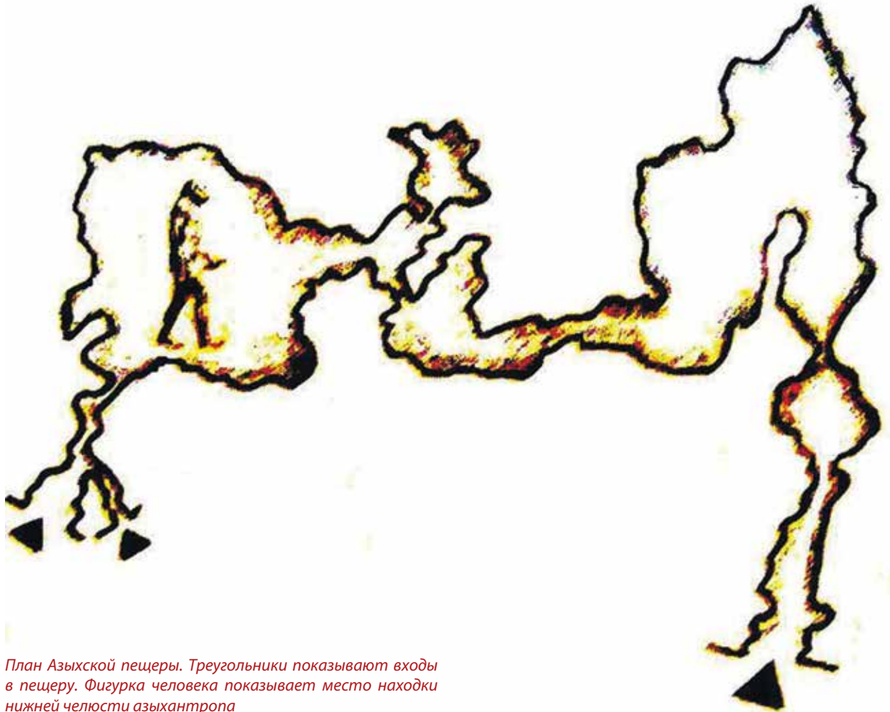
План Азыхской пещеры. Треугольники показывают входы в пещеру. Фигурка человека показывает место находки нижней челюсти азыхантропа

63; 4). Найденные здесь каменные орудия труда и гигантолиты говорят в пользу теории об универсальности общих законов развития человеческого общества. Наряду с этим, в Азыхской пещере обнаружены кости до 40 видов диких животных, в том числе серого медведя, пещерного льва, носорога, лошади.