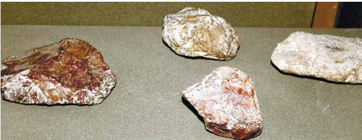
Орудия труда из булыжника (Гуручайская культура)

Человек мустьерского времени обладал уже заметно развитым внутренним миром, мог понимать суть и соотношение цветов. Свиде-