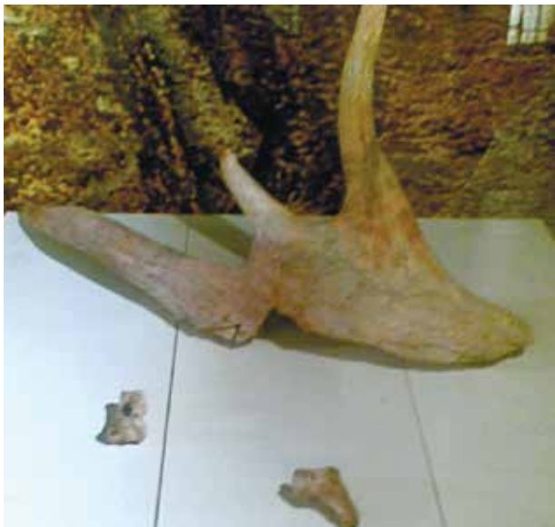
Кости оленя из пещеры Азых. НМИА

Даш-Салахлы. Азыхская пещера – единственный в стране многоярусный памятник, относящийся к нижнему антропогену, и он доказывает факт обитания древнего человека на территории Азербайджана около 2 млн. лет назад.