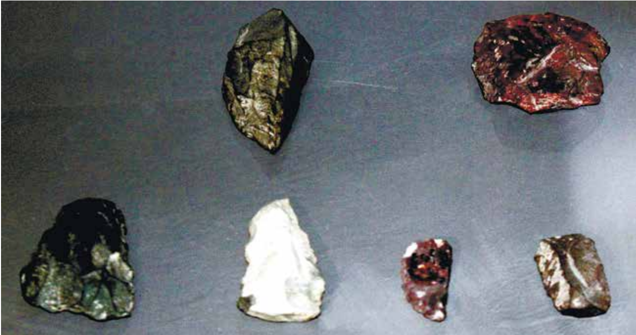
Орудия труда из булыжника и обсидиана (III культурный слой)

и речь, а также располагал некоторыми элементами духовной культуры. Следует заметить, что в позднем ашеле (порядка 100 тыс. лет назад) жизнь азыхантропа разительно отличалась от прежних периодов: пласты позднего ашеля не только содержат множество орудий труда, но и насыщены предметами, свидетельствующими о прогрессе духовной культуры.