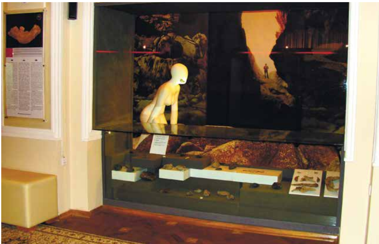
Раздел в экспозиции НМИА, посвященный Азыхской пещере

Так, здесь были найдены каменные конструкции и фрагмент челюсти человека, жившего почти 400 тыс. лет назад. В VII-X ярусах присутствуют артефакты раннего каменного века: в III, V и IX ярусах выявлено более 15 тыс. каменных изделий нижнего палеолита (3, с. 12). Всего же в пещере имеются 10 культурных пластов общей мощностью 10-14 м. Древнейшие из них, V-X пласты относятся к дошельскому времени и представляют гуручайскую археологическую культуру (1,2 – 0,7 млн. лет назад) (3, с. 62). Среди них первые орудия труда – секачи, колющие и роющие инструменты. Древнейшие материалы Азыхской пещеры сходны с материалами олдувайской археологической культуры Восточной Африки (3, с.