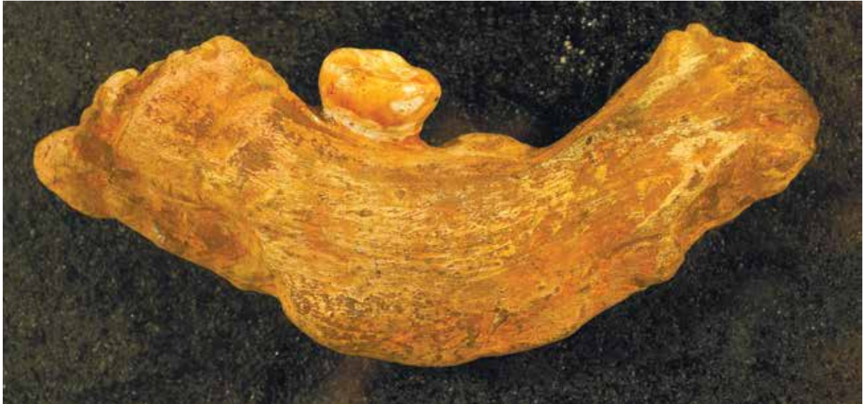
Нижняя челюсть азыхантропа. Хранится в НМИА

тельством сказанного могут служить найденные в Азыхской пещере изделия с красочной цветовой гаммой (3, с. 146).